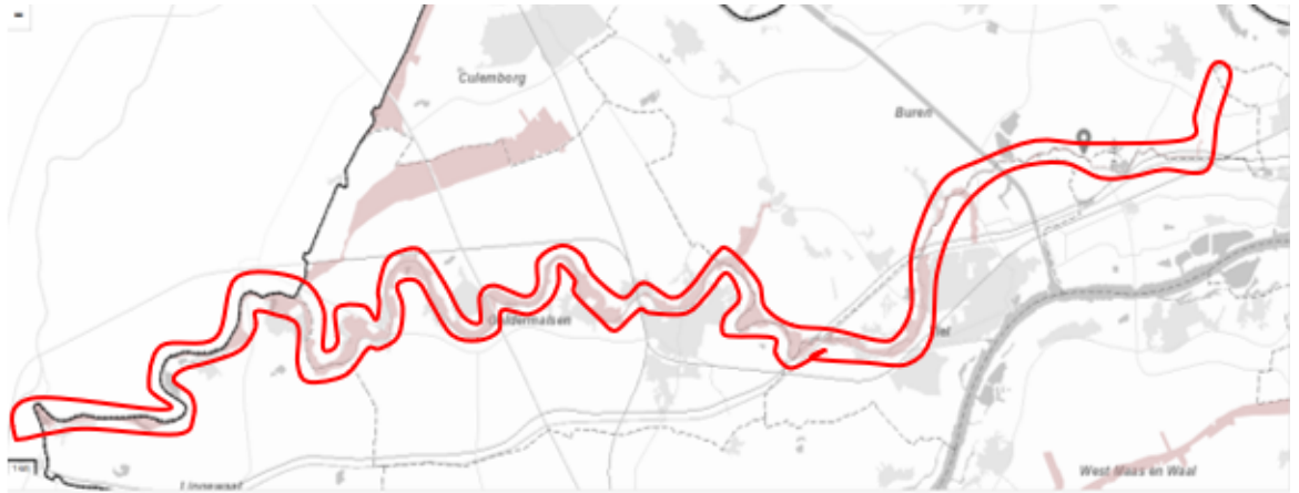
Zoekgebied EVZ Heumen-Horsens