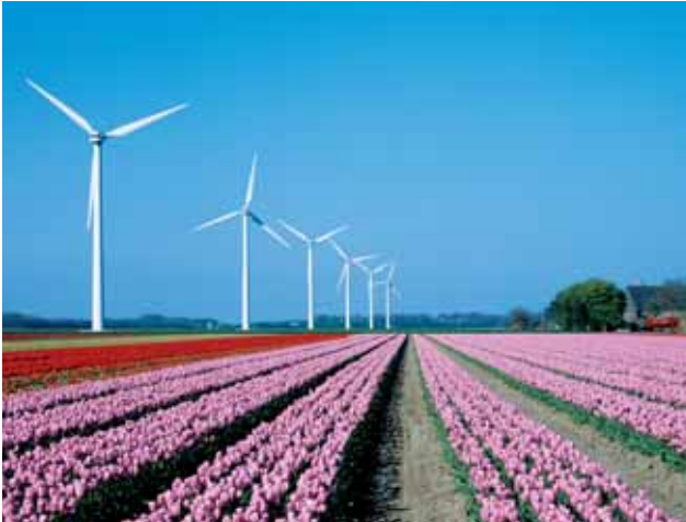
Bollenvelden en windmolens: nieuw landschap in de Noordoostpolder.

ruime vergoedingsmogelijkheden. In eventuele onderhandelingen met Brussel zal moeten worden gewezen op het productiebeperkende effect van de maatregelen waarvoor de vergoeding wordt voorgesteld. Ook zal moeten worden benadrukt dat de borging van landschap als publieke waarde om een concurrerende tegemoetkoming vraagt.