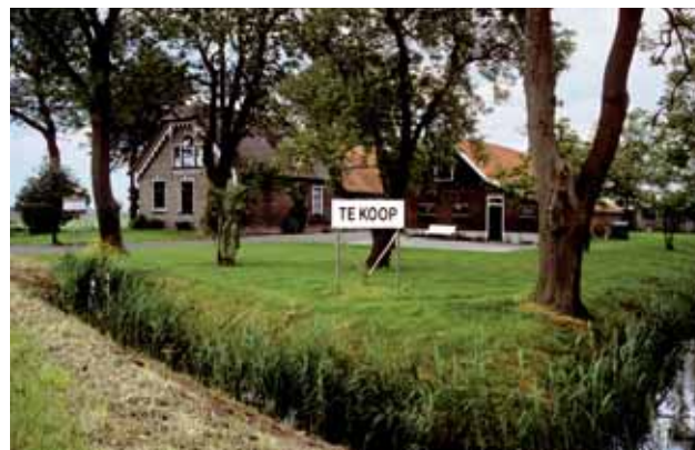
Economische ontwikkelingen in de landbouw leiden tot nieuwe bewoners op het platteland: boerderij te koop in Zevenhuizen, Zuid-Holland.

De nu zo gewaardeerde agrarische cultuurlandschappen zijn door de jaren ontstaan als onbedoelde bijproducten van het economisch rendabel agrarisch grondgebruik. Houtwallen en poelen leverden de boeren voordeel op: ze hielden het vee bijeen en