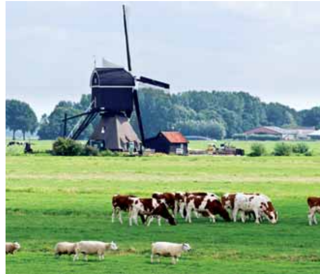
De Tiendwegse wipmolen in Hardinxveld-Giessendam, als onderdeel van een authentiek agrarisch cultuurlandschap.

Nodig provincies uit om een Provinciale Landschapsfonds in te stellen en scherp het ruimtelijk instrumentarium zodanig aan dat provincies mogelijkheden krijgen om extra financieringsbronnen aan te boren door verplichtende 'bovenplanse verevening'. Creëer zelf een Nationaal Landschapsfonds voor cofinanciering van maatregelen binnen de Nationale Landschappen. Voed het Nationaal Landschapsfonds met bestaande Rijksbijdragen en middelen uit het Fonds Economische Structuurversterking. Zorg voor extra vulling van het NLF door het bestaande compensatieprincipe voor verlies aan natuurwaarden bij investeringen in de (rijks)infrastructuur aan te vullen met landschapscompensatie. Leg een verbinding met de inzet van GLB middelen in het Plattelandsontwikkelingsprogramma. Benut de 'Health Check'