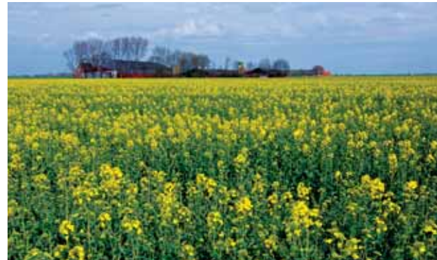
Bloeiend koolzaadveld in het Oldambt.

Vanaf de jaren '70 groeit het bewustzijn dat een eenzijdig op de landbouw gerichte landinrichting ongewenste effecten heeft op de natuur-, recreatie- en landschapswaarden van het buitengebied. Het Rijk organiseert daarom tegendruk en koopt gronden aan voor