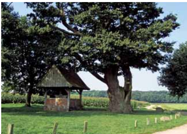
Eén van de overgebleven onverharde wegen door het agrarische cultuurlandschap.

De vorming van fondsen is geen doel op zich, maar een manier om een betere samenhang en continuïteit van financiële middelen te garanderen. Van belang is het onderscheid te noemen tussen de vulling van fondsen met financiële middelen en de zeggenschapsstructuur die hoort bij de besteding van die middelen en het beheer van de fondsen. Fondsen worden beheerd door een bankinstelling. Dat kan iedere bank zijn. Bundeling van fondsenbeheer biedt echter aantrekkelijke mogelijkheden om uitvoeringskosten te verlagen en het rendement op het ingelegde vermogen te verbeteren. Hierdoor komen meer middelen voor het landschap beschikbaar.