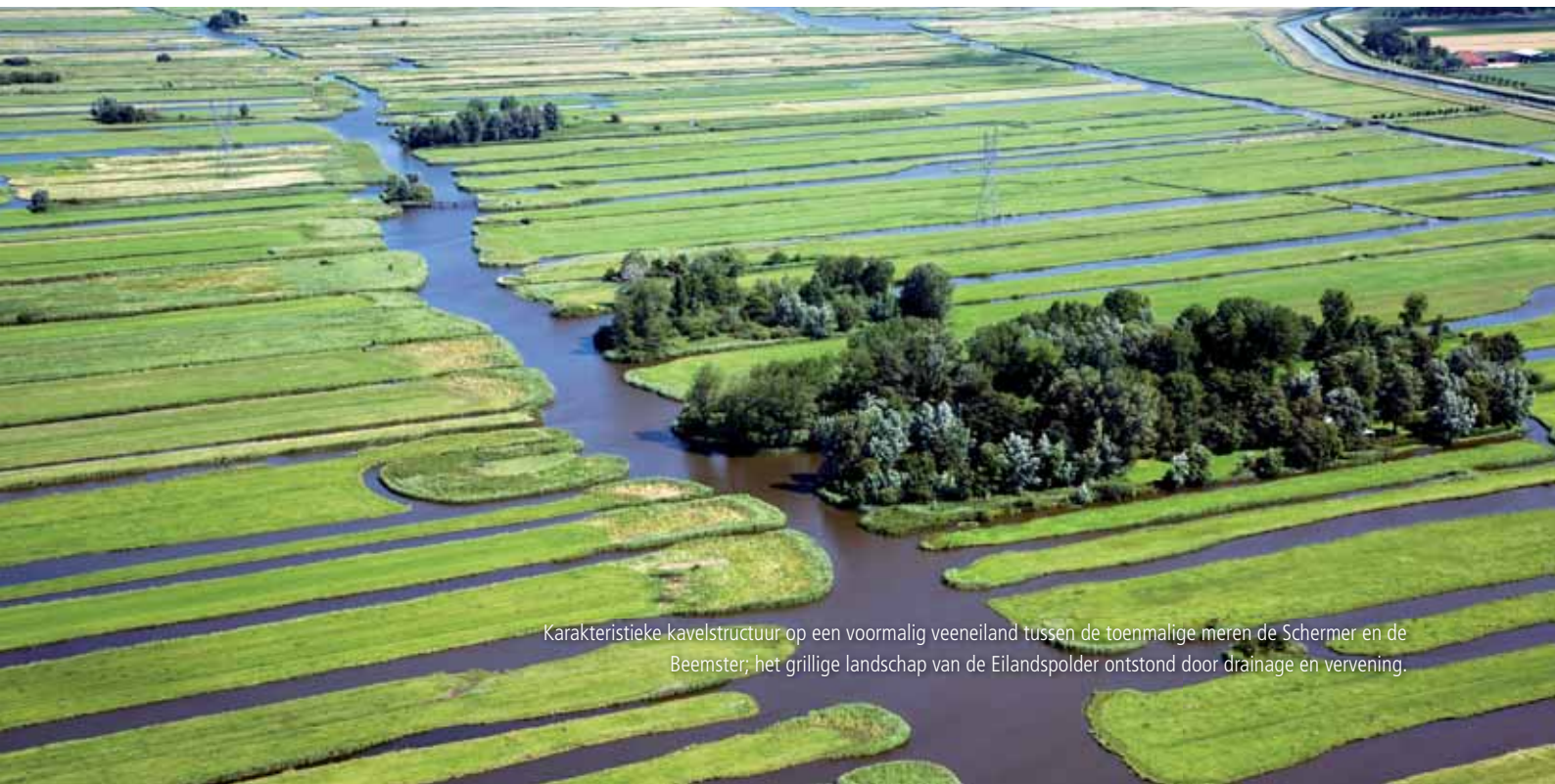
Karakteristieke kavelstructuur op een voormalig veeneiland tussen de toenmalige meren de Schermer en de Beemster; het grillige landschap van de Eilandspolder ontstond door drainage en verving.