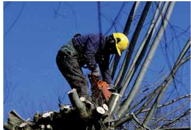
Onderhoud van het landschap: een man aan het knotten in Nijbroek, Overijssel.

Duur en omvang van de vergoedingen uit publieke middelen zijn ingegeven en begrensd door de regels rond staatssteun van de Europese overheid. Hierdoor kunnen in de praktijk de subsidies onvoldoende concurreren met het rendement dat boeren uit agrarische productie kunnen halen. De vergoedingen komen daarnaast slechts voor een klein deel ten goede aan boeren