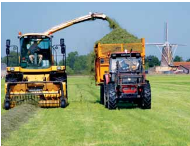
Typerend agrarisch zomertafereel: hooien op Walcheren.

We hebben tot slot gekeken naar de mogelijkheden om middelen van grote financiers als banken of institutionele beleggers voor het landschap aan te trekken. Participatie van enige omvang en termijn door dergelijke financiers vraagt banken en beleggers echter om genoeg te nemen met een laag financieel rendement op ingelegd vermogen: een rendementseis van 6 tot 12 % is met investeringen in landschap nu eenmaal zelden of nooit te behalen.