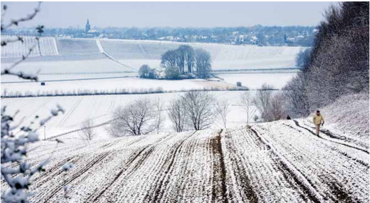
Sint Pietersberg, Maastricht. Wandelaars lopen langs de besneeuwde akkers in het Jekerdal.

In de landbouw zal het streven naar bedrijfseconomisch optimale productieomstandigheden doorgaan. Ook de verwachte demografische en economische ontwikkelingen, de klimaatverandering en het streven naar een duurzame energievoorziening zullen de komende decennia leiden tot nieuwe ruimtelijke aanpassingen met effecten op de landschapskwaliteit. Het gevaar van aantasting is door de hoge ruimtedruk het grootst in de agrarische cultuurlandschappen die dicht bij de stad zijn gelegen. Maar daarnaast kan ook meer verspreide bebouwing sterk afbreuk doen aan de landschappelijke kwaliteit van een gebied ('verrommeling').