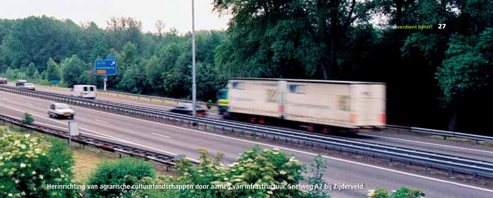
Herinrichting van agrarische cultuurlandschappen door aanleg van infrastructuur. Snelweg A2 bij Zijderveld.

agrarische cultuurlandschappen te vervullen, wanneer overheden kunnen zorgen voor duurzame perspectieven die al dan niet aanvullend kunnen concurreren met agrarische productie: landschap verdient beter!