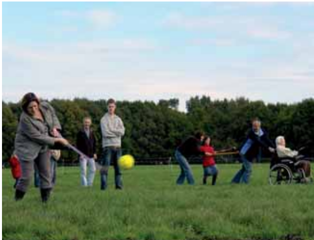
Nieuwe economische kansen door 'stedelijke' vraag: een familie uit de Randstad viert de verjaardag van oma (in rolstoel) met een partijtje boerengolf in Koolwijk; landschap verdient beter!

De voorbeeldgebieden zijn zeker geen unieke initiatieven. Berenschot heeft in opdracht van het ministerie van LNV een overzicht gemaakt van het scala aan nieuwe initiatieven, die in veel gevallen aanhaken op burgerbetrokkenheid bij de eigen leefomgeving in gebieden onder stedelijke druk 4 . In de tekst en de kaders bij dit advies zijn ter illustratie een willekeurige selectie van aansprekende voorbeelden opgenomen. De ervaringen met deze initiatieven zijn vaak nog te prematuur om conclusies op te baseren over de mate van succes en overdraagbaarheid naar andere regio's. Wel is helder dat het schaalniveau waarop veel van de initiatieven plaatsvinden, de herkenbaarheid en de bewustwording en daarmee ook de kansen op private bijdragen bevorderen. Tegelijk geeft het ook de belangrijkste beperking aan: zonder enige mate van ordening, opschaling en ondersteuning van bovenaf blijven lokale initiatieven naast en los van elkaar bestaan. De gewenste kwaliteit en de recreatieve toegankelijkheid van ons landschap zijn daarom niet veilig te stellen door alleen