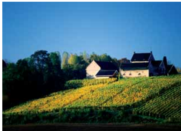
Wijnboerderij in het Limburgse heuvellandschap, nabij Maastricht.

Wij beperken ons in dit advies tot de financiering van maatregelen in gebieden binnen Nederland, waar de landbouw de dominante grondgebruiker is. In lijn met de terminologie in het plan 'Nederland weer Mooi – Deltaplan voor het Landschap' noemen we die gebieden 'agrarische cultuurlandschappen'. De reden voor deze afbakening is dat zowel voor stedelijk groen als voor natuur al aparte financieringsconstructies bestaan om de landschappelijke kwaliteit ervan op peil te houden. Het gaat binnen agrarische cultuurlandschappen overigens niet uitsluitend om agrarisch grondgebruik: naast agrarische ondernemers zijn in toenemende