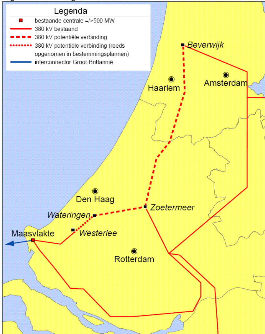
Figuur: aanvulling kaart 1 in het SEV II

Beslissing van wezenlijk belang 2: de in deze pkb aangewezen projectminister zal uitvoeringswijze en ruimtelijke inpassing van verbinding 27 vastleggen in een rijksprojectbesluit, overeenkomstig het gestelde in paragraaf 6. Daarbij wordt uitgesloten dat in speciale beschermingszones meer dan verwaarloosbare effecten zullen optreden.