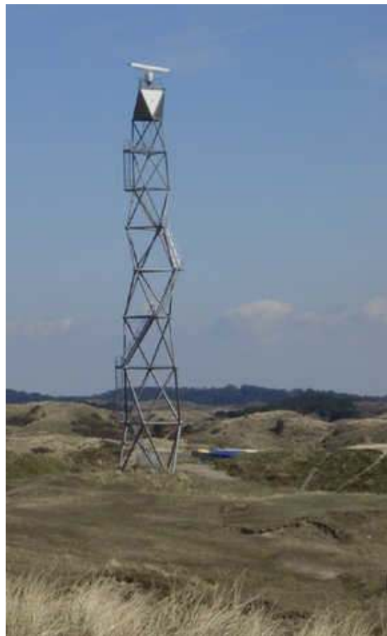
Nieuwe radarmast Petten ?