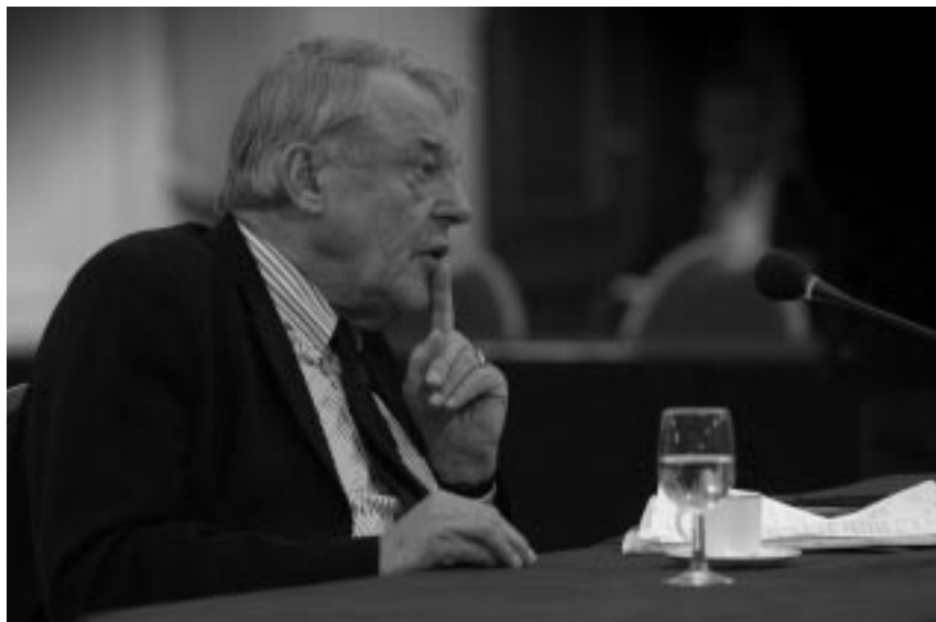
De heer H.A.F.M.O. van Mierlo