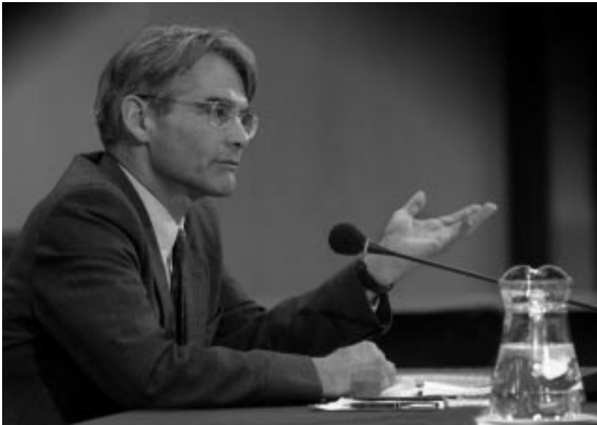
General Sir Rupert A. Smith