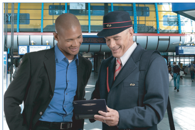
Informatie via servicemedewerker

Deze tekening geeft een impressie van de mogelijke invulling van maatregelen.