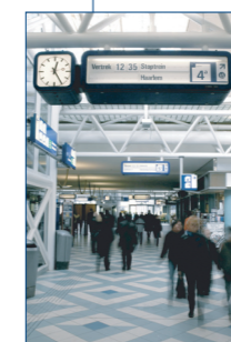
Reisinformatie via CTA