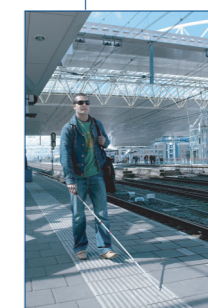
Geleidelijnen tot langs het perron