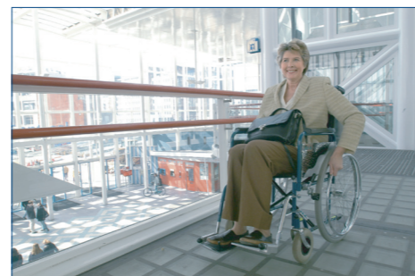
Lift en dubbele leuning