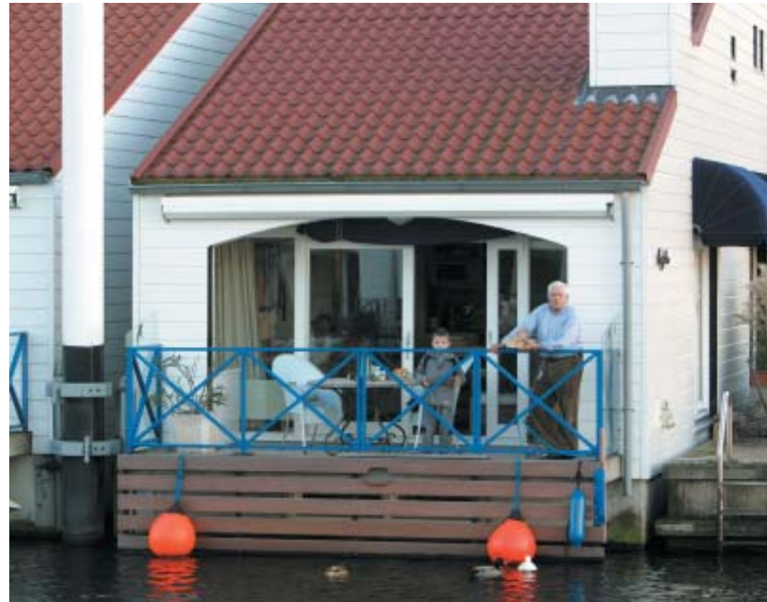
Marina-Oolderhuske in Roermond.

Experimenteren met aangepast bouwen betekent op zoek gaan naar heel nieuwe oplossingen voor heel gewone gebruiks-