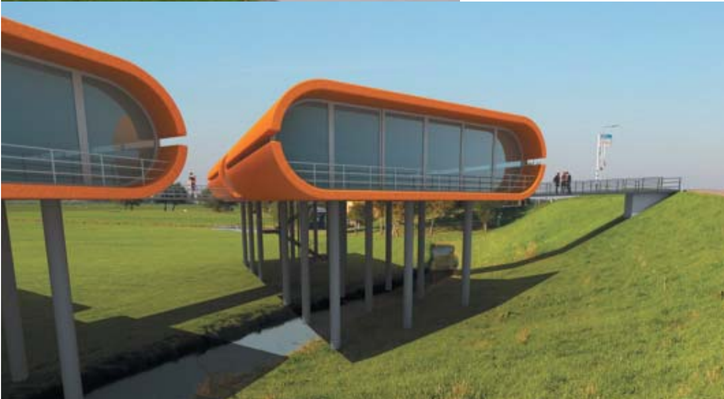
Ontwerpen voor aangepaste bouwvormen in uiterwaarden.