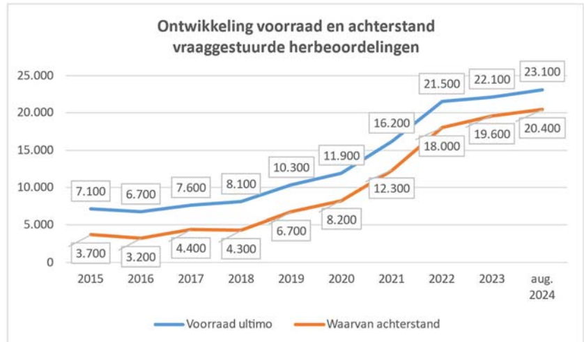
Figuur 3: Ontwikkeling van de achterstanden bij de vraaggestuurde herbeoordelingen (aantal aanvragen waarvoor de wettelijke termijn van acht weken is verstreken) en van de totale werkvoorraad (aantal aanvragen nog binnen de wettelijke termijn plus de achterstanden).

In de voortgangsbrief van 21 mei jl. is gemeld dat er de komende periode geen daling van de achterstand op herbeoordeling wordt verwacht. Dat komt doordat de prioriteit ligt op WIA-claimbeoordelingen. Inmiddels is duidelijk dat voor zowel de vraaggestuurde als de professionele herbeoordelingen geldt dat de verwachting is dat de voorraad en achterstand zullen gaan stijgen per 2025. Ook voor andere sociaal-medische dienstverlening die UWV biedt, zoals de dienstverlening in de Ziektewet, de monitoring WGA 80/100 en de deskundigenoordelen, verwacht UWV dat zij hier vanaf 2025 nog minder vaak aan toe komt. Dit is het gevolg van het feit dat de WIA-claimbeoordelingen prioriteit krijgen boven die andere sociaal-medische dienstverlening. Nu het verschil tussen het aantal beoordelingen dat UWV kan doen en het aantal WIA-aanvragen dat UWV ontvangt naar verwachting vanaf 2025 weer toeneemt, neemt het verdringingseffect ten aanzien van de hiervoor genoemde andere sociaal-medische dienstverlening toe.