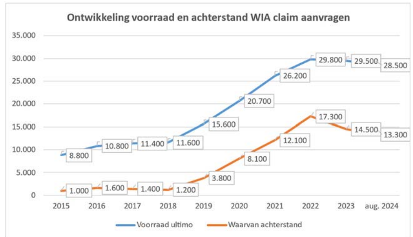
Figuur 2: Ontwikkeling van de achterstanden bij de WIA-claimbeoordeling (aantal aanvragen waarvoor de wettelijke termijn van acht weken is verstreken) en van de totale werkvoorraad (aantal aanvragen nog binnen de wettelijke termijn plus de achterstanden).

Het aantal mensen dat langer dan zes maanden wacht op een claimbeoordeling is tot en met augustus 2024 verder gedaald naar circa 2.400. In maart 2024 ging het nog om 3.100 mensen. Het blijft de inzet van UWV om ervoor te zorgen dat eind 2024 nagenoeg niemand langer dan zes maanden op een WIA-claimbeoordeling hoeft te wachten.