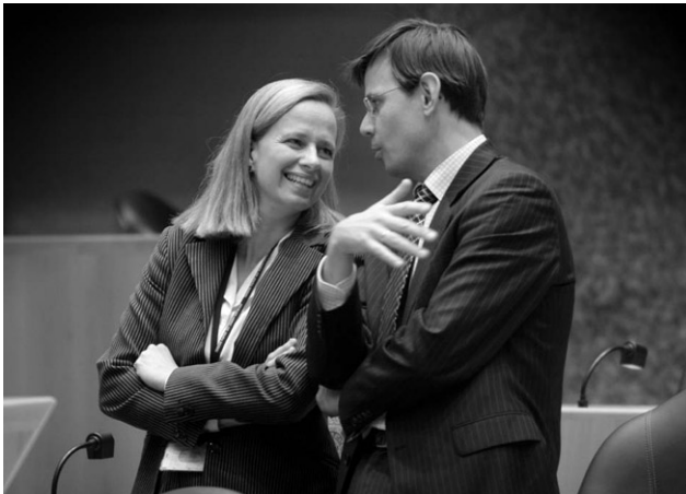
Mevrouw Van der Laan (D66) en de heer Rouvoet (ChristenUnie)

drongen. In 2005 was de onderwijsarbeidsmarkt in evenwicht.