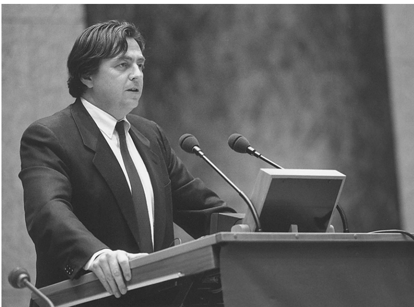
De heer Wijers, Minister van Economische Zaken

Vragen van het lid M.B. Vos aan de ministers van Volkshuisvesting, Ruimtelijke Ordening en Milieubeheer en van Economische Zaken, over de CO 2 -brief (15-09-1995) en de reacties van RIVM/CPB en ECN daarop (NRC 23-09-1995) .