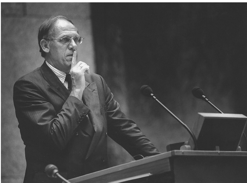
De heer Dijkstal, Minister van Binnenlandse Zaken

strijdigheid is tussen de uitspraak en het wetsvoorstel, voor zover ik dat nu uit de krant heb kunnen beoordelen. Het wetsvoorstel gaat immers om evenredige vertegenwoordiging en het opstellen van een document. Maar om het debat hier echt goed te kunnen voeren, is het goed dat er commentaar ligt van mijn kant naar aanleiding van de uitspraak van het Hof. Dat zal dus nog enige tijd in beslag nemen. Ik zal de Kamer zo spoedig mogelijk een brief hierover sturen.