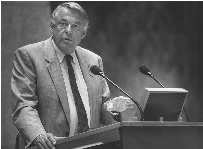
De heer Van Mierlo, Minister van Buitenlandse Zaken

dat hij de leider is van een partij die deelneemt aan de regering en die dus naar mijn mening niet de ruimte behoort te nemen om op een essentieel onderdeel, als het ware buiten deze zaal, het voorstel te doen, het beleid te wijzigen.