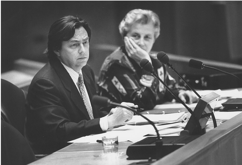
Minister Wijers van Economische Zaken en minister Borst-Eilers van Volksgezondheid, Welzijn en Sport

voor hem regeltjes moeten verzinnen. Dat is onderschatting van de consument.