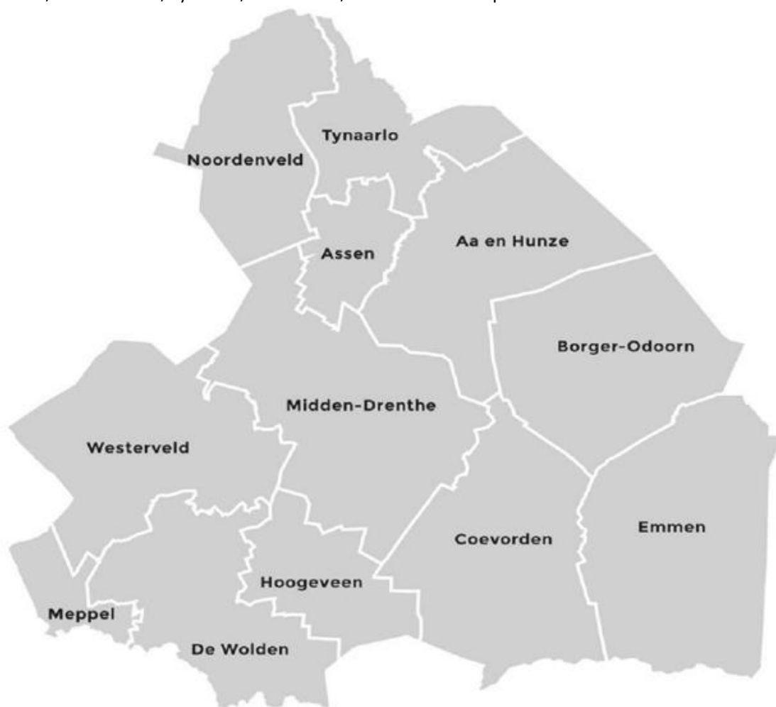
Figuur 2. Overzicht van het werkgebied van OD Drenthe

De U&H-strategie milieu betreft het werkgebied van OD Drenthe (zie afbeelding hieronder). Het betreft de gemeenten Aa en Hunze, Assen, Borger-Odoorn, Coevorden, Emmen, Hoogeveen, Meppel, Midden-Drenthe, Noordenveld, Tynaarlo, Westerveld, De Wolden en de provincie Drenthe.