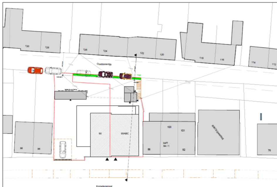
Figuur 1. Bestaande situatie ter plaatse van de Kometensingel 88 / 90 De te onttrekken strook van de Oostzanerdijk heeft een groene kleur. Het betreft een strook eigen grond die door verjaring openbare weg is geworden.

Bijkomend voordeel van het verbreden van het talud en zo meer in de berm van de Oostzanerdijk te parkeren is dat er ter plaatse meer ruimte voor het verkeer op de Oostzanerdijk ontstaat, wat de doorstroming ten goede komt. Het profiel van de dijk is doorgaans zeer krap.