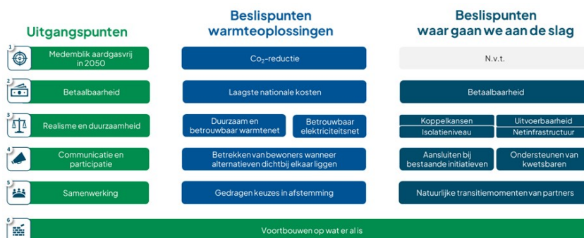
uitgangspunten en beslispunten

De beslispunten helpen ons ook om te kiezen in welke wijken we de komende jaren aan de slag gaan. Een overzicht van de uitgangspunten en beslispunten staat in de figuur hieronder.