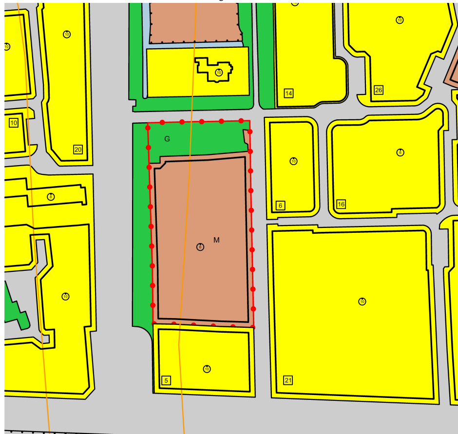
Middenstraat 27a te Sappemeer