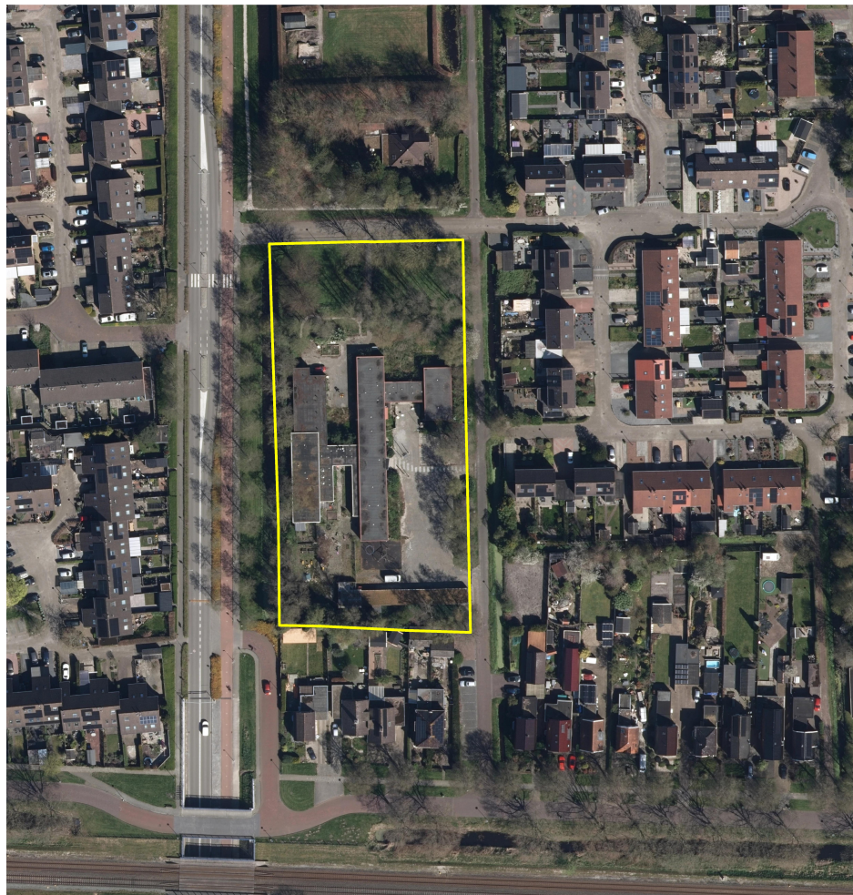
Middenstraat 27a te Sappemeer