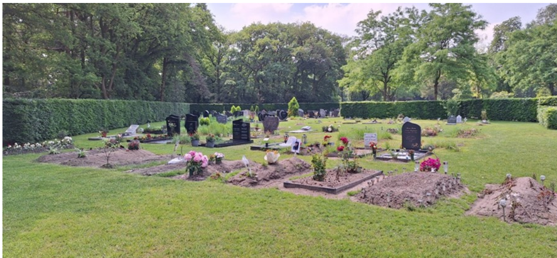
Islamitische graven – begraafplaats Rosmalen