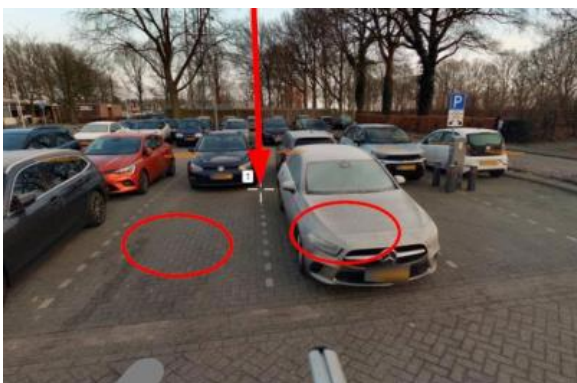
Ratelaar nabij huisnummer 3 te Nieuw-Buinen met laadpaal staat aan de Veenbesstraat