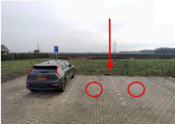
Hoofdstraat nabij huisnummer 62 te Exloo