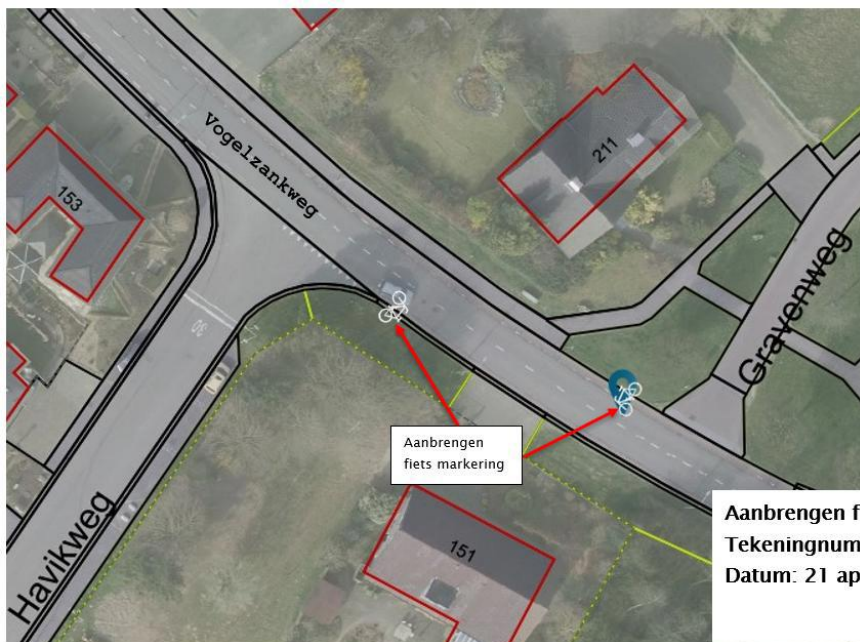
Aanbrengen fietsmarkering Vogelzankweg Tekeningnummer FdG-2026-04-21 1/3 Datum: 21 april 2026