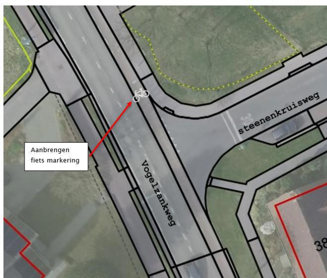
Aanbrengen fietsmarkering Vogelzankweg Tekeningnummer FdG-2026-04-21 3/3 Datum: 21 april 2026