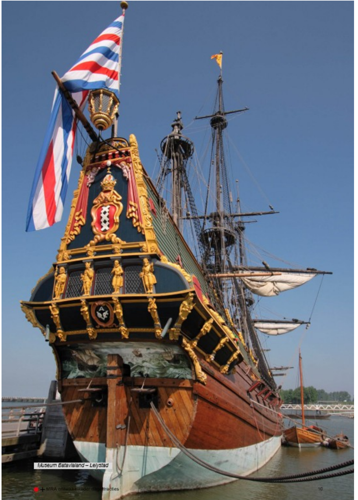
Museum Batavialand – Lelystad