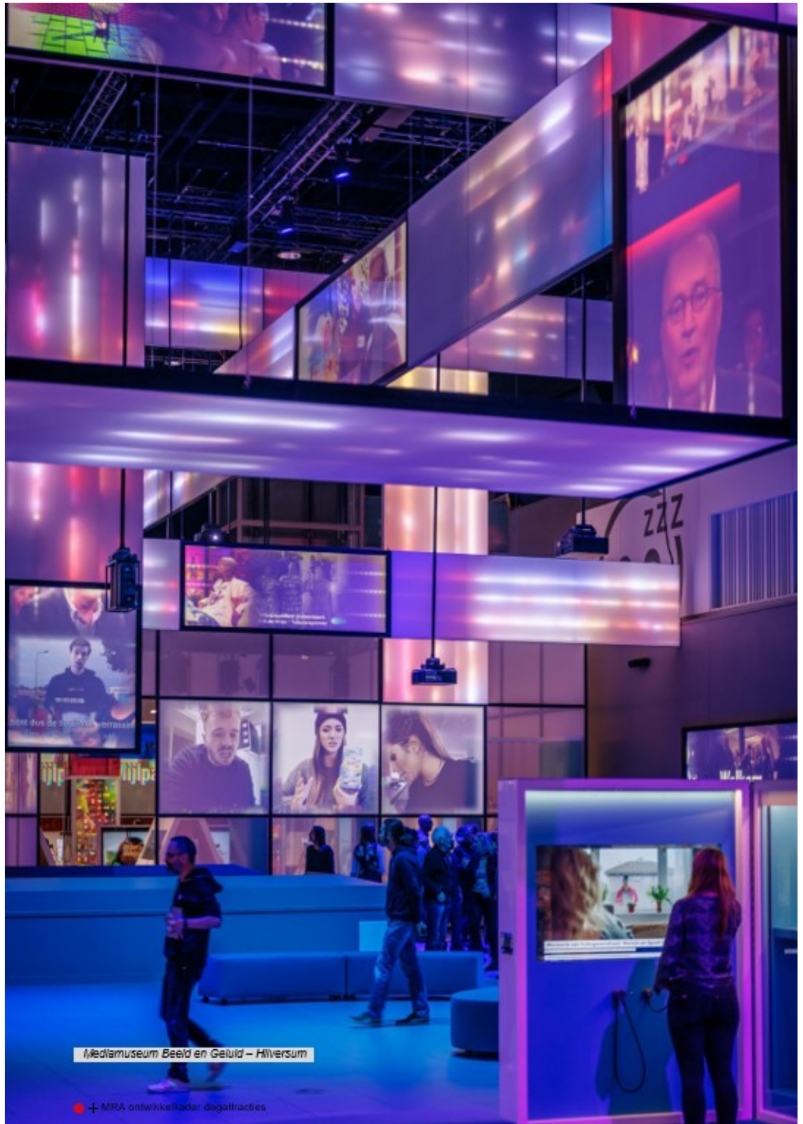
Mediamuseum Beeld en Geluid – Hilversum