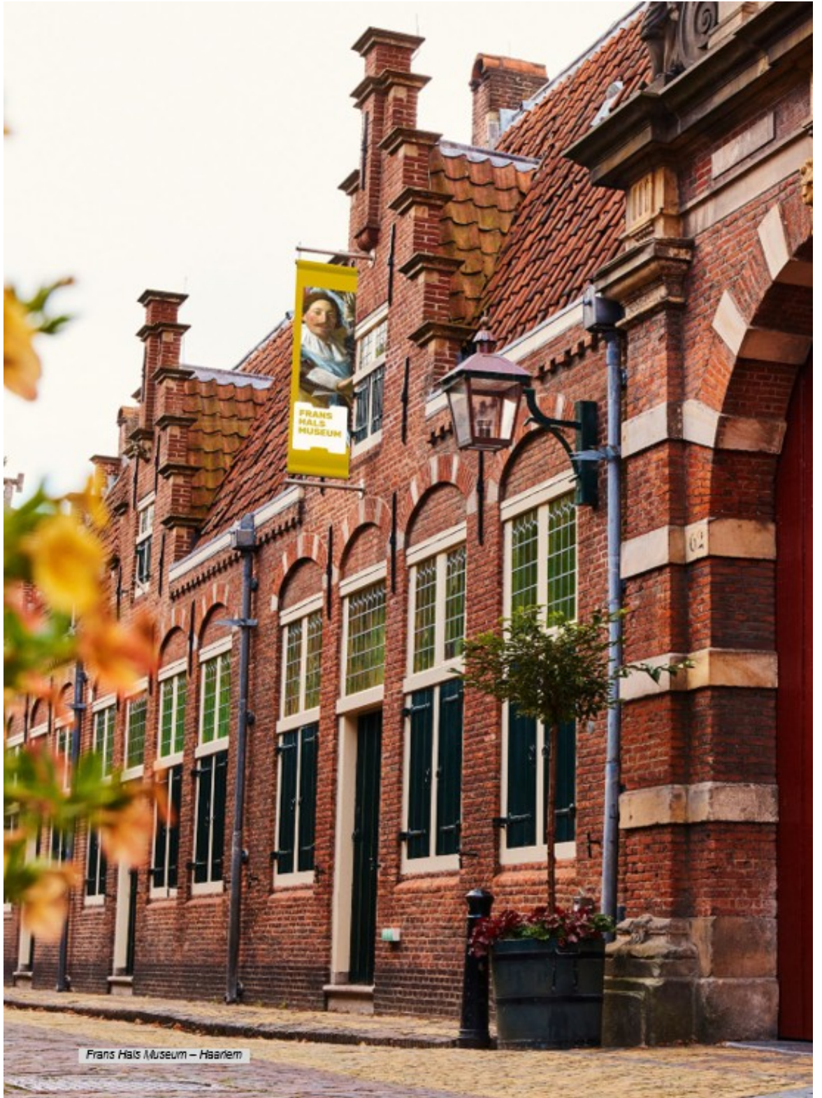
Frans Hals Museum – Haarlem