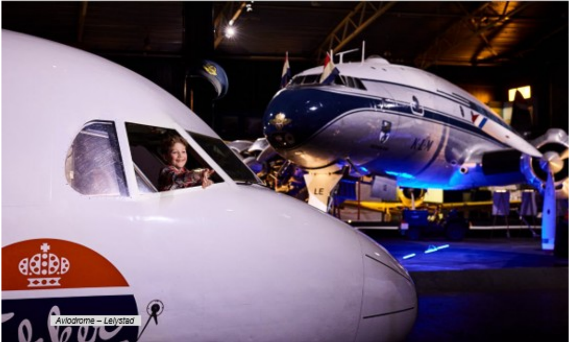
Aviodrome – Lelystad