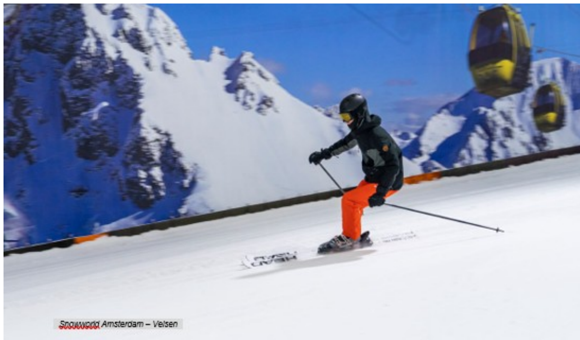
Snowworld Amsterdam – Velsen