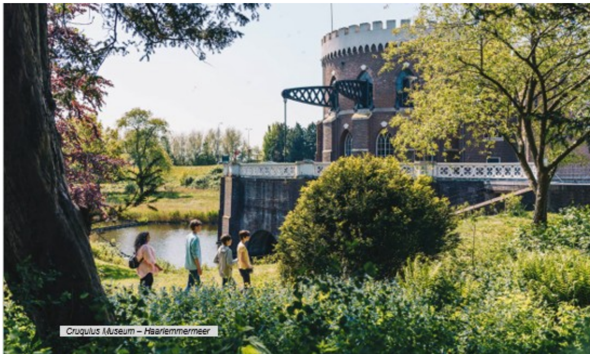
Cruquius Museum – Haarlemmermeer