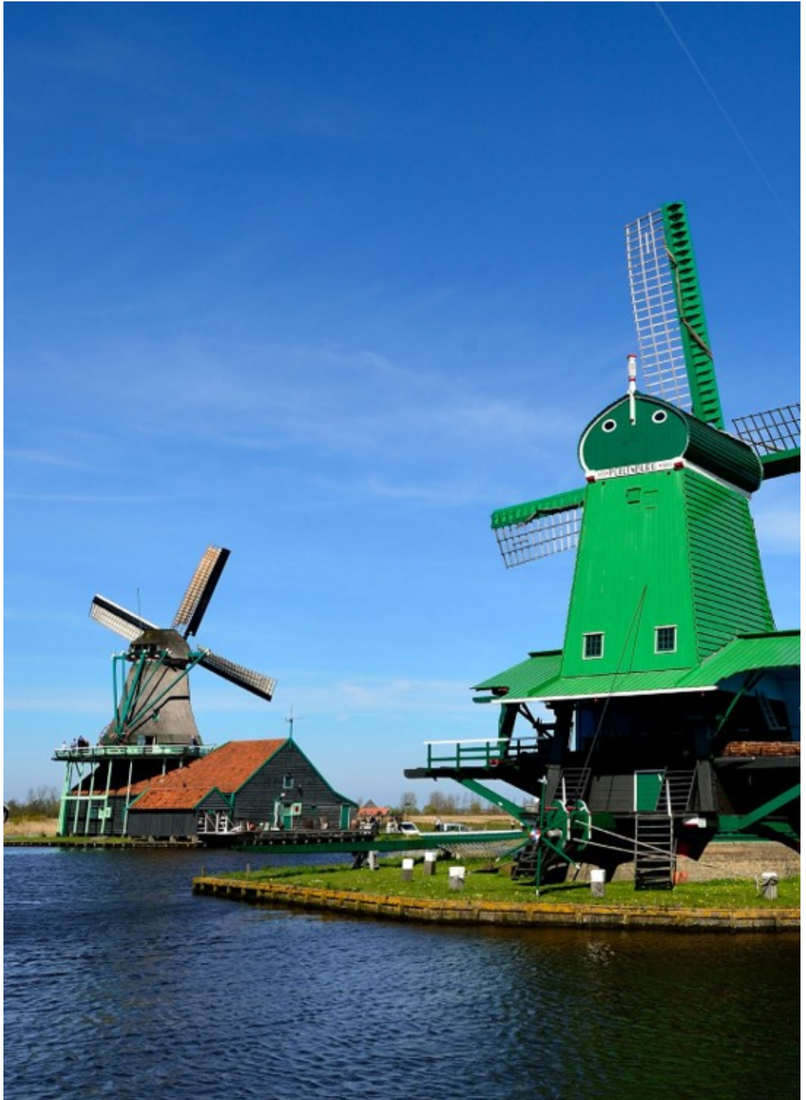
Zaanse Schans – Zaanstad Dit is een uitgave van de Metropoolregio Amsterdam Termini 179, 1025 XM Amsterdam info@metropoolregioamsterdam.nl www.metropoolregioamsterdam.nl