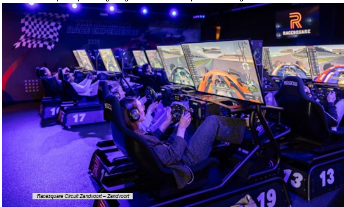
Racesquare Circuit Zandvoort – Zandvoort

De leden van het expertteam proberen samen tot feedback te komen. Het ontwikkelkader werkt niet met punten of scores. De feedback van het expertteam betreft een bespiegeling van het plan op basis van de verschillende aspecten van het MRA ontwikkelkader en bevat voorstellen hoe minder aanwezige onderdelen verbeterd kunnen worden. Zo krijgen initiatiefnemers de mogelijkheid om het plan te verbeteren als dat de wens van de gemeente is. De feedbackbrief is geen rapport met aan het eind een voldoende of onvoldoende. Het is een handvat voor gemeenten dat helpt in haar besluit om al dan niet aan een plan mee te werken. De feedback richt zich dan ook vooral op de duurzame toegevoegde waarde van het plan op de omgeving en het toeristisch profiel van de gemeente.