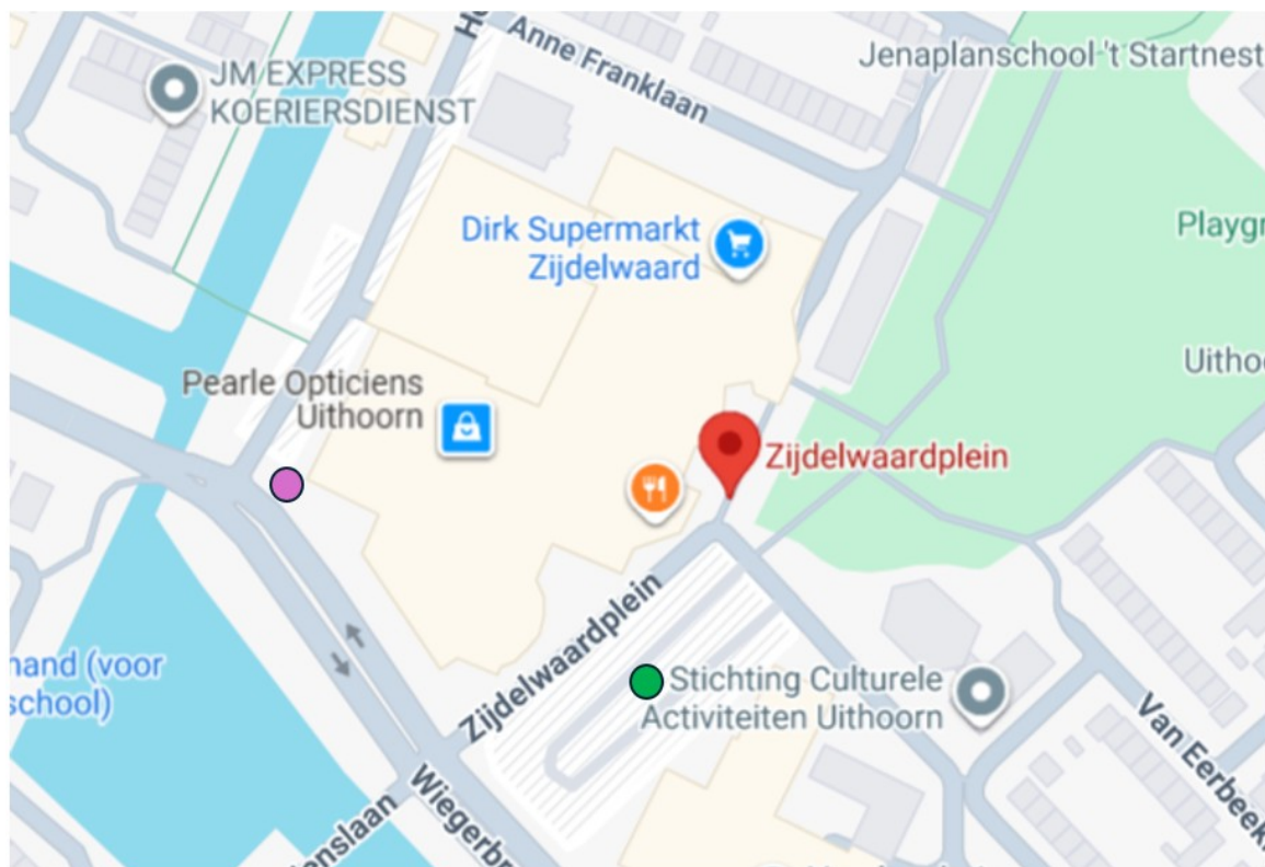
Kaart: 2 camera's Zijdelwaardplein Uithoorn