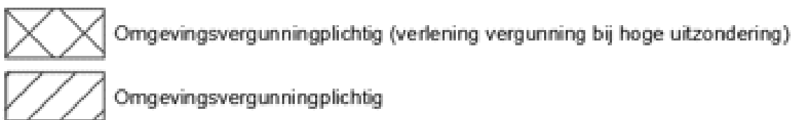
Figuur 1: Afstand woning omgevingsvergunningplichtig kappen bomen in bosvillagegebieden