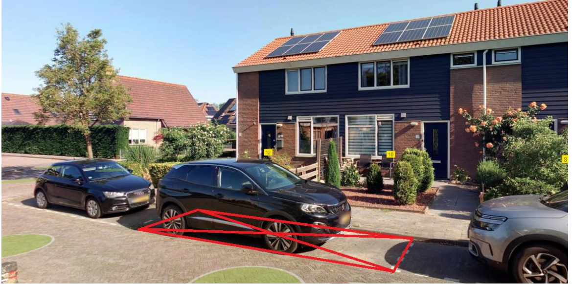
Afbeelding behorende bij verkeersbesluit met kenmerk 1932408 d.d.: 01-07-2026

Aldus besloten te Zevenbergen, 01-07-2026.