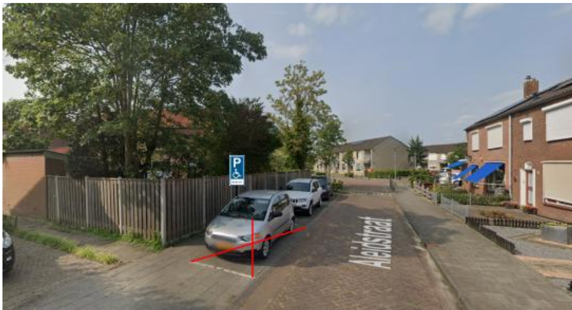
Afbeelding behorende bij verkeersbesluit met kenmerk 1934026 d.d.: 01-07-2026

Aldus besloten te Zevenbergen, 01-07-2026.