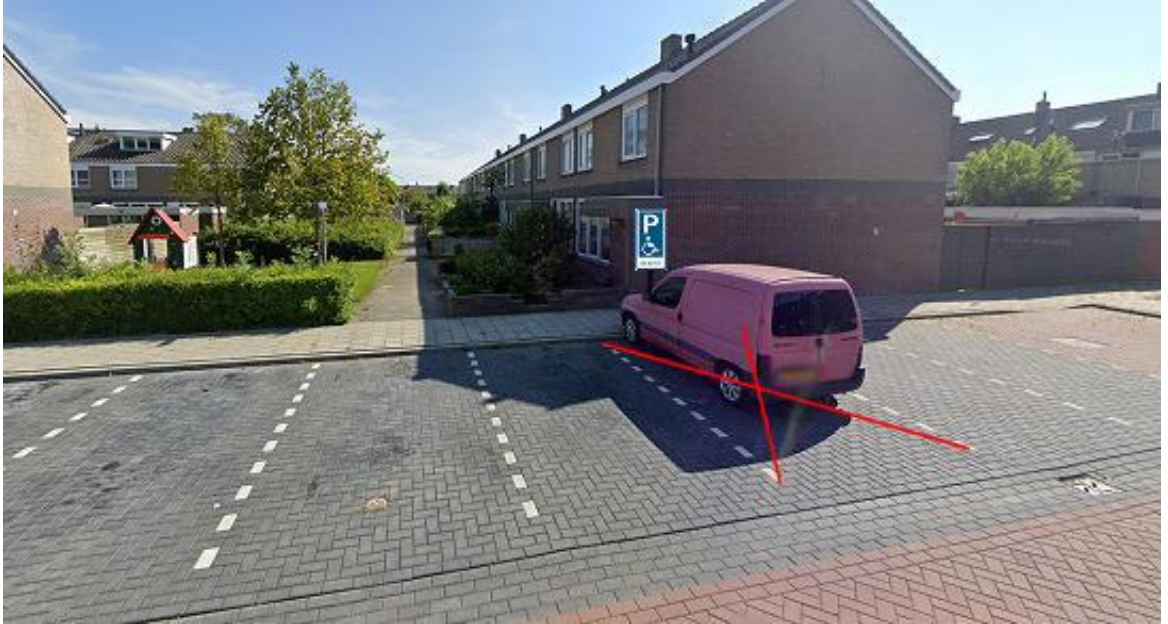
Afbeelding behorende bij verkeersbesluit met kenmerk 1934310 d.d.: 23-06-2026

Aldus besloten te Zevenbergen, 23-06-2026.