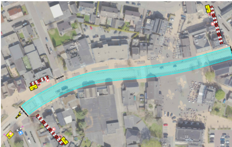
Tijdelijk inrijverbod Hoofdstraat - Voorthuizen