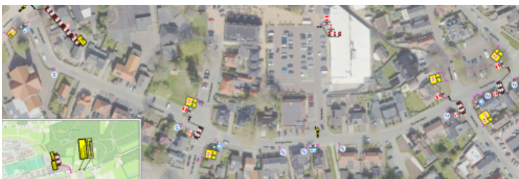
Tijdelijke parkeerverbod en tijdelijke eenrichtingsweg Koninginnelaan - Voorthuizen