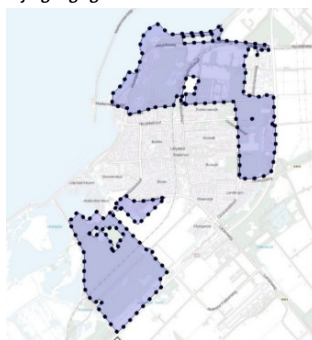
Figuur 1: Wijzigingsgebieden Technische transitie, fase 2

Met deze wijziging zijn de stadsrandgebieden omgezet naar het omgevingsplan (zie Figuur 1).