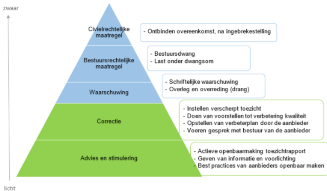
Figuur 2: Piramide handhavingsmaatregelen

Zoals hierboven is vermeld, kan de toezichthouder advies, stimulering en correctie toepassen. De gemeente kan dwang toepassen om het nalevingsgedrag van aanbieders te bevorderen, om risico's te verminderen en de kwaliteit van ondersteuning te verbeteren. De toezichthouder en de gemeente hanteren de volgende piramide (zie figuur 2) naar zwaarte van de maatregel, bij het inzetten van interventies.