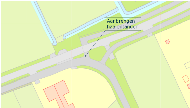
Locatie Stroomdalpad – Oisterwijksebaan.