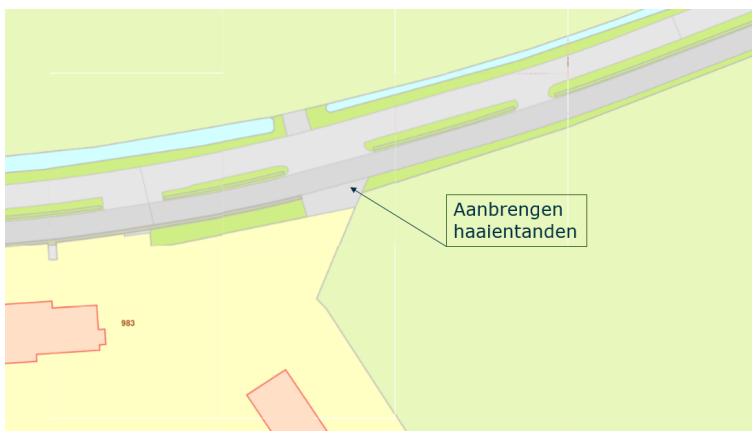
Locatie Stroomdalpad - De Zaalt.