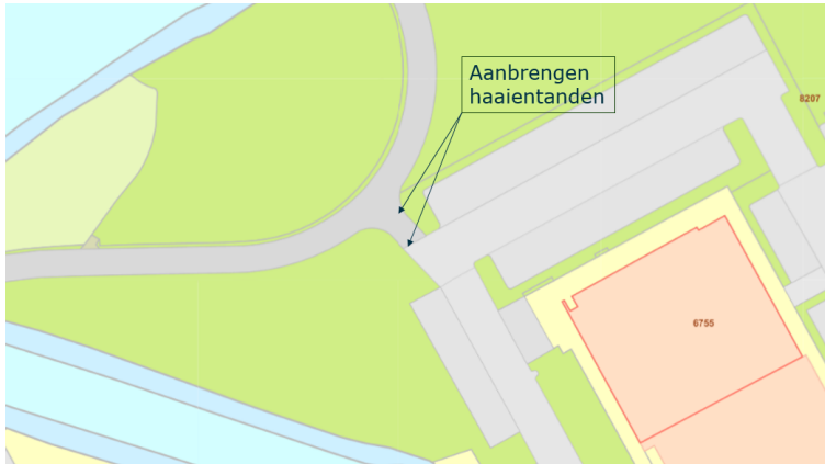
Locatie Stroomdalpad - 't Seuverick