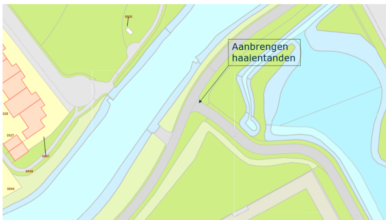
Locatie Stroomdalpad – Donkpad.