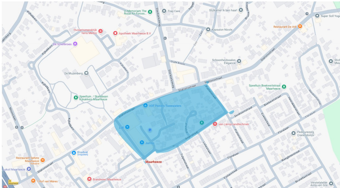
Kaart 4. Stationstraat, Smits van Oyenlaan en Molenstraat