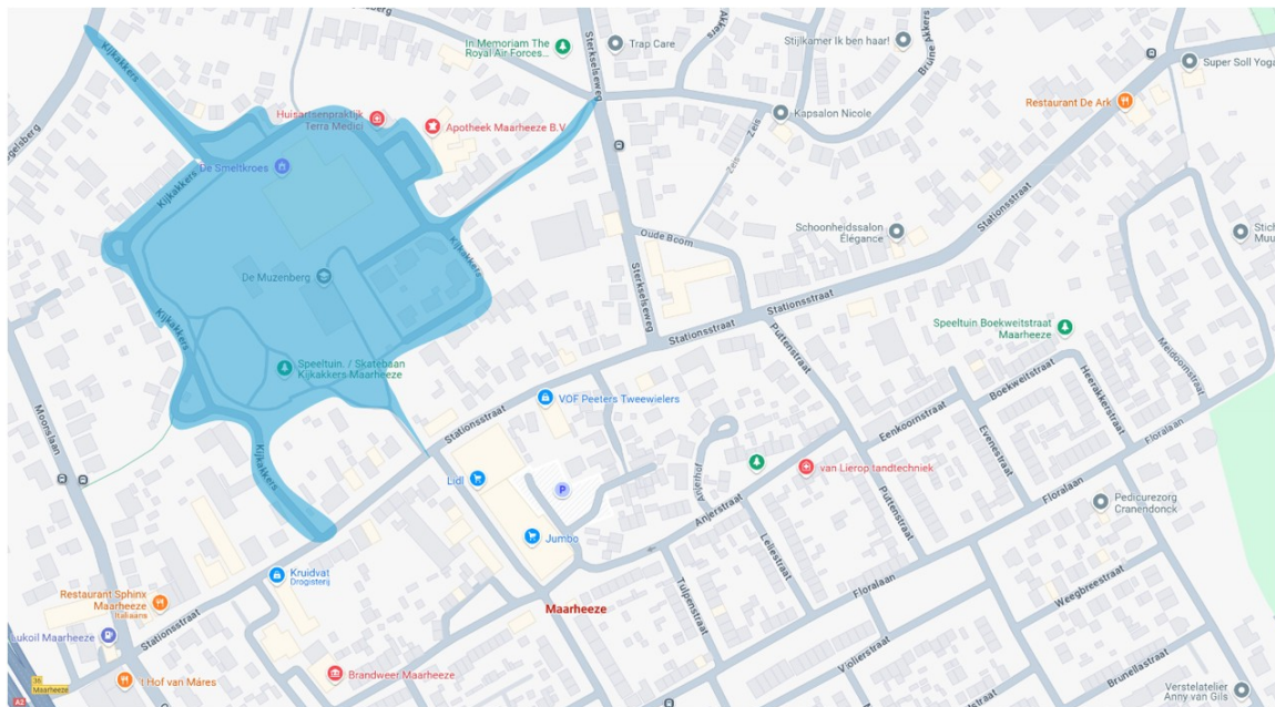
Kaart 2. Stationsstraat