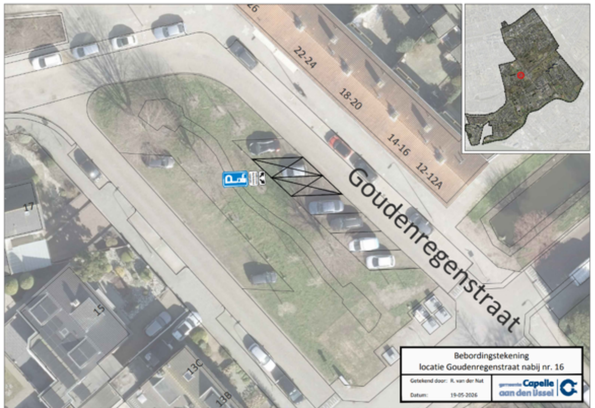
Bebordingstekening locatie Goudenregenstraat nabij nummer 16