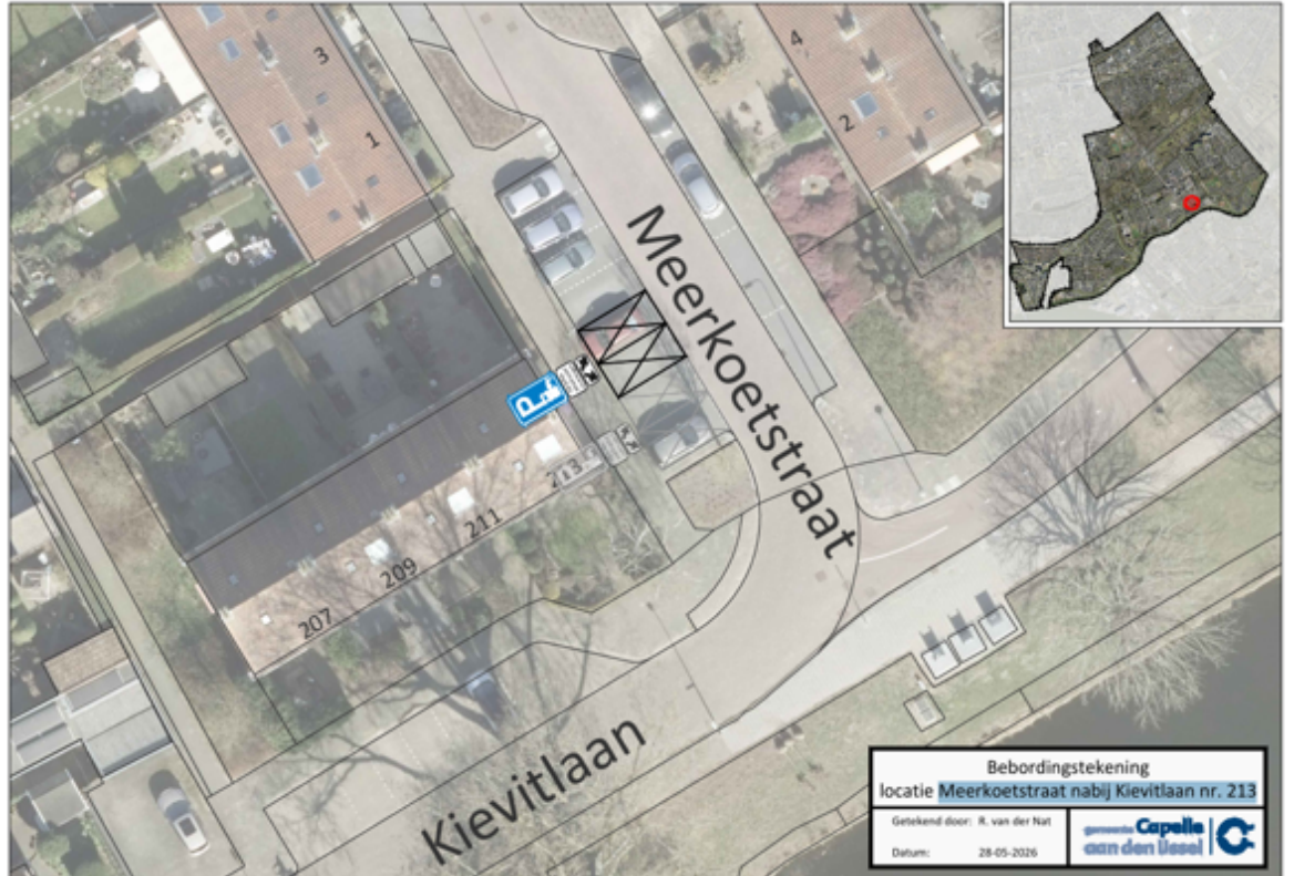
Bebordingstekening locatie Meerkoetstraat nabij Kievitlaan nr. 213