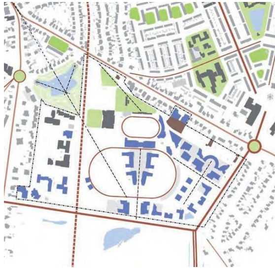
Figuur 2.1 Afbeelding Welstandsnota gemeente Hilversum herziening 2022

In de 'Welstandsnota gemeente Hilversum herziening 2022' is het Arenapark beschreven als kantorenpark (Gebied 7B in hoofdstuk 4). De criteria voor dit gebied zijn toegespitst op een kantorenlocatie.