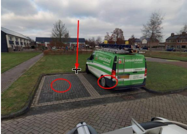
Sportlaan nabij huisnummer 47 te Nieuw-Buinen;