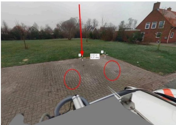
Gildeweg nabij huisnummer 11 te Valthermond.