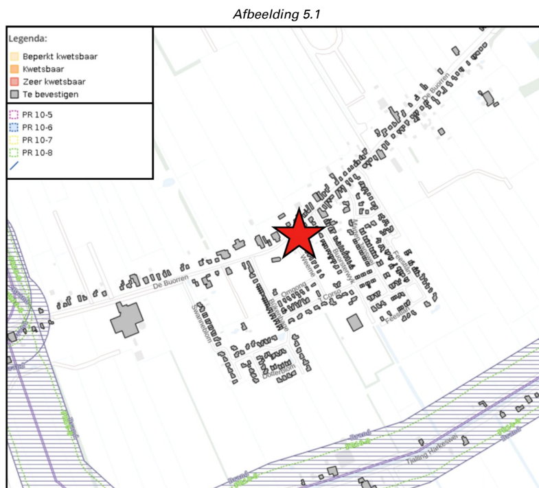
Uitsnede risicokaart Externe Veiligheid

In onderstaande afbeelding (5.1) is een uitsnede zichtbaar van de kaart Externe Veiligheid van de Atlas voor de leefomgeving. Hierin is het plangebied met een rode ster aangeduid.