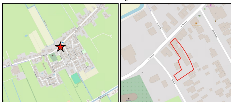
Locatie ten opzichte van Lippenhuizen en Gorredijk