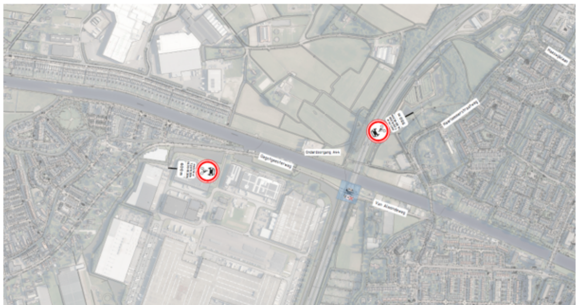
Situatietekening te plaatsen vooraankondigingsborden 'gesloten voor alle motorvoertuigen' op Haarlemmerstraatweg en Oegstgeesterweg

Aldus vastgesteld op 9 juni 2026 te Oegstgeest,