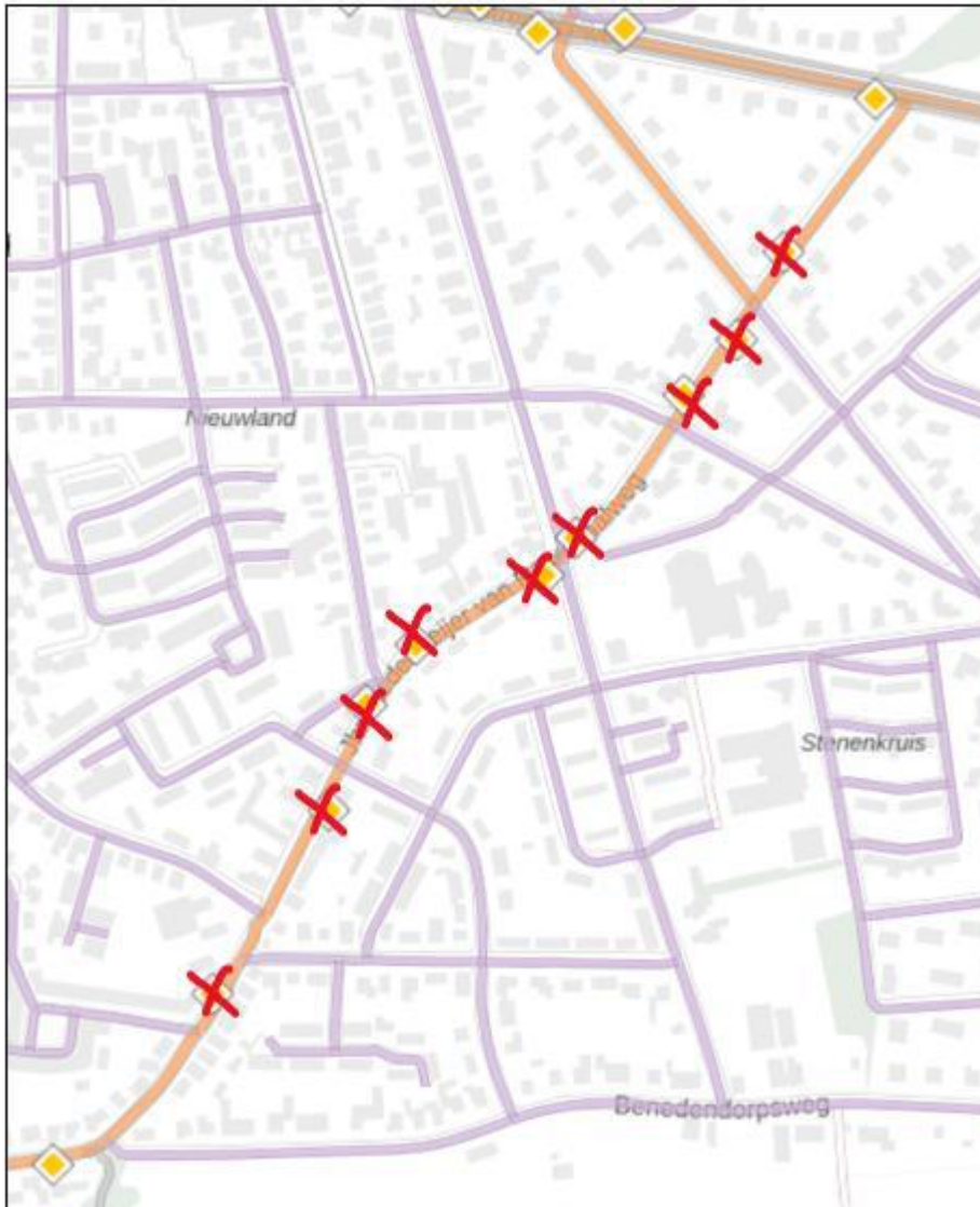
Verwijderen borden B1 (9x)