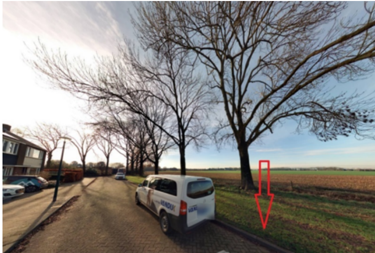
23. Hengel 23 te Grave: