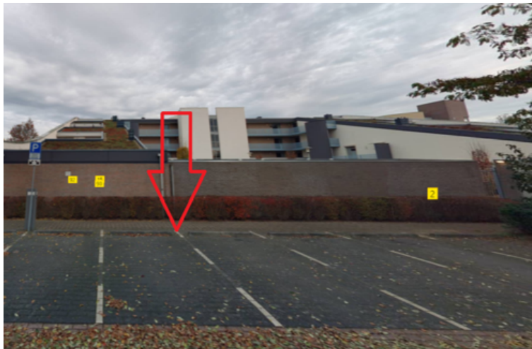
21. Zwaardvegersstede 29 te Cuijk: