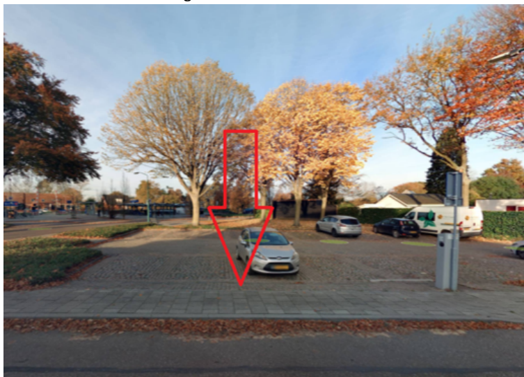
42. Maalderijstraat 1 te Wanroij: