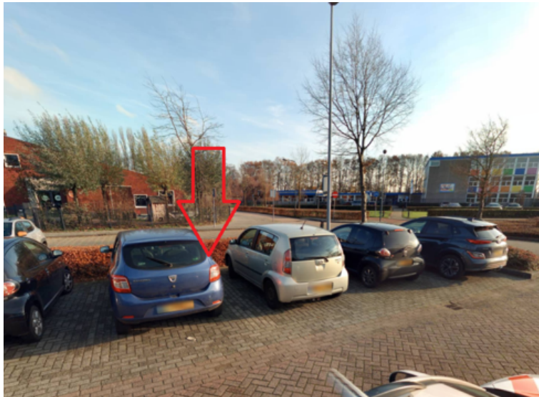
31. Pastoor Maasstraat 1a te Mill: