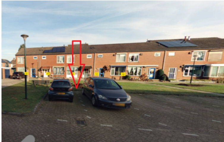
29. Julianastraat 4 te Mill: