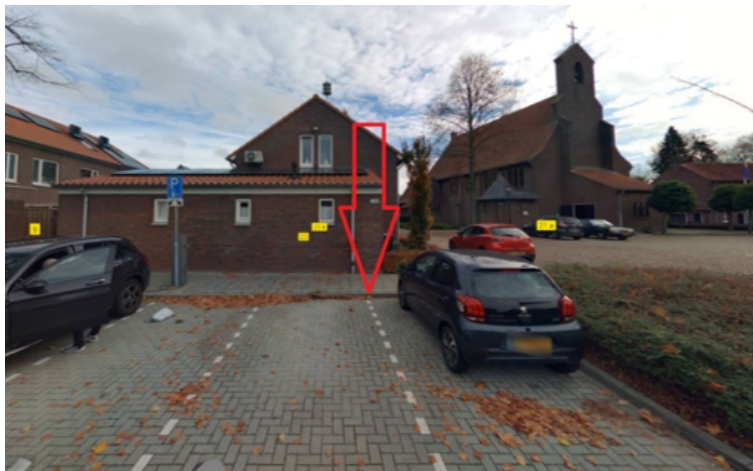
40. Merletgarde 22 te Vierlingsbeek: