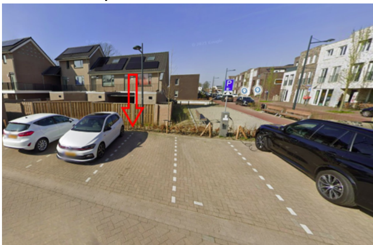
12. Houtsnipwal 20 te Cuijk: