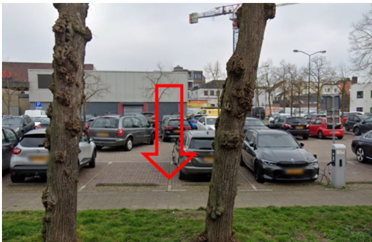
7. Krekelzanger 91 te Boxmeer: