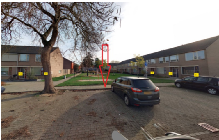
17. Sportlaan 13 te Cuijk: