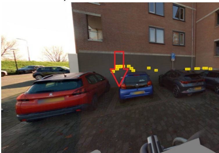
16. Rozenobel 31 te Cuijk: