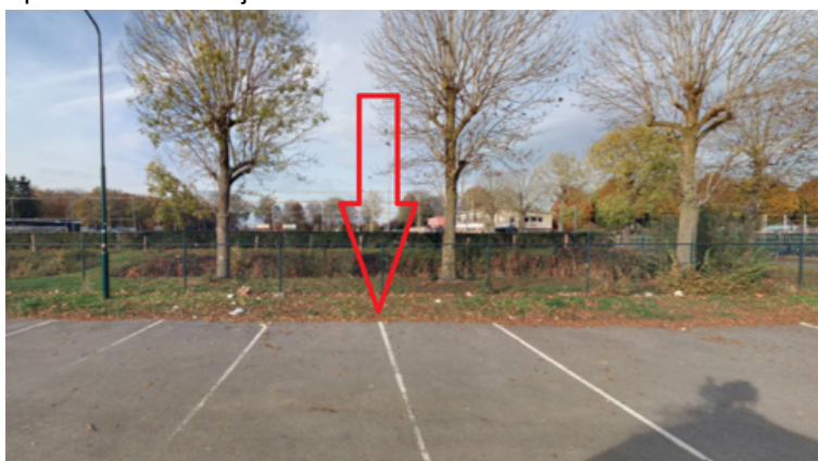
18. Wegedoorn 148 te Cuijk: