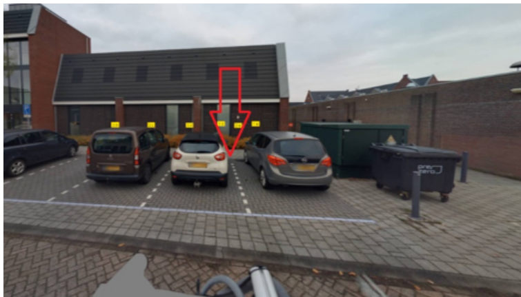
30. Langenboomseweg 1e te Mill: