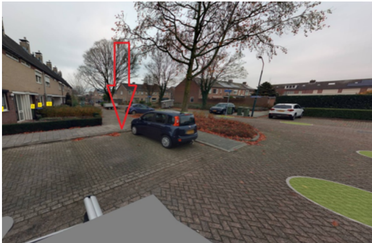
6. Koorstraat 32 te Boxmeer: