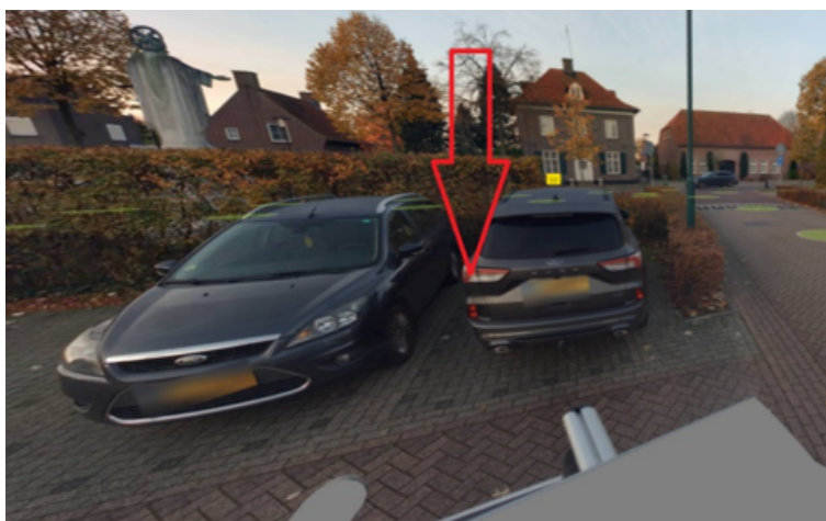
28. Buizerdstraat 12 te Mill: