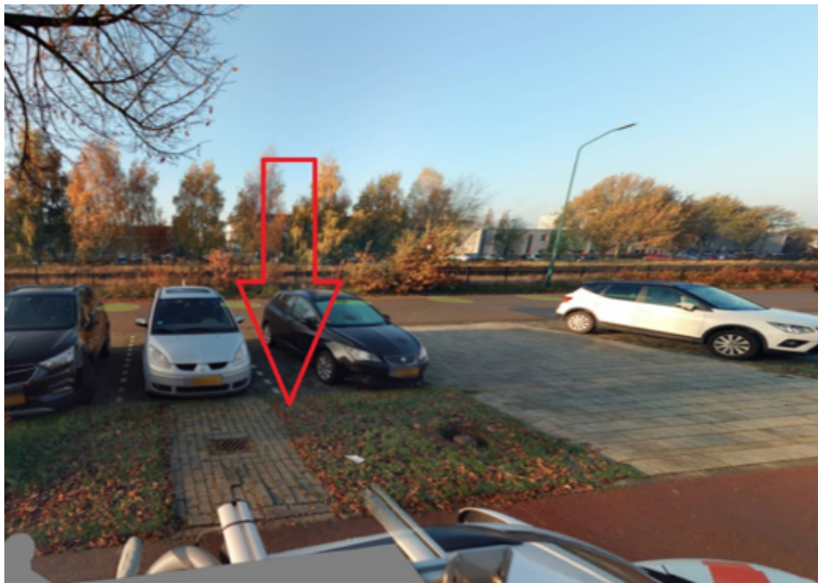
11. De Wiel 20a te Cuijk: