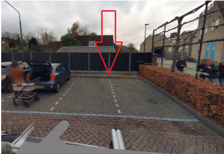
5. Jacob Marisstraat 2 te Boxmeer: