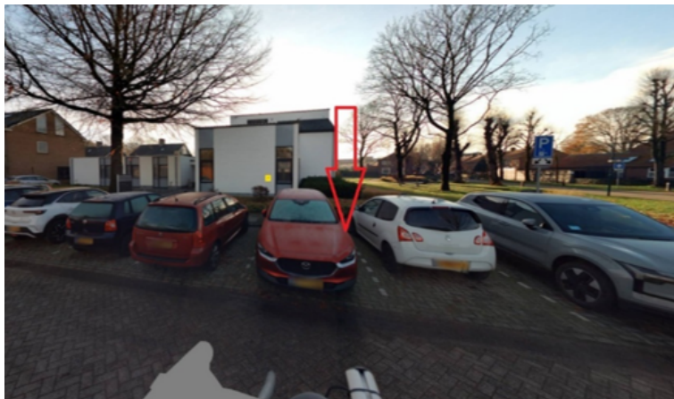
9. Prinses Margrietstraat 83 te Boxmeer: