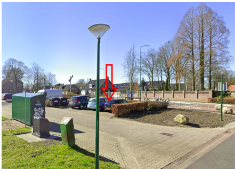
27. Kalverstraat 1a te Maashees: