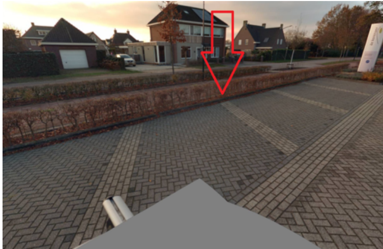
39. Tolschestraat 23 te Velp: