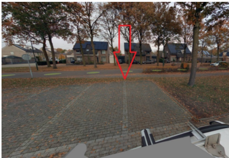
26. Kerkstraat 4 te Haps: