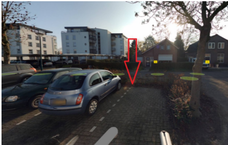
10. Stationsweg 38b te Boxmeer: