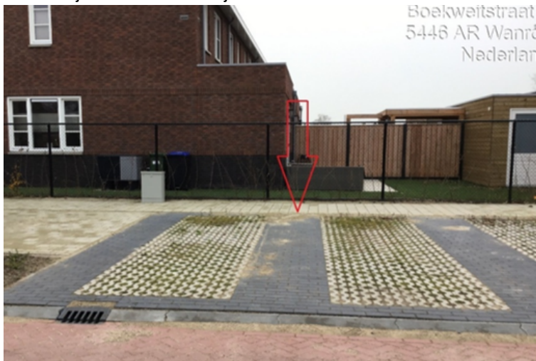
43. Maalderijstraat 15 te Wanroij: