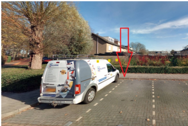
22. Emmastraat 7 te Grave: