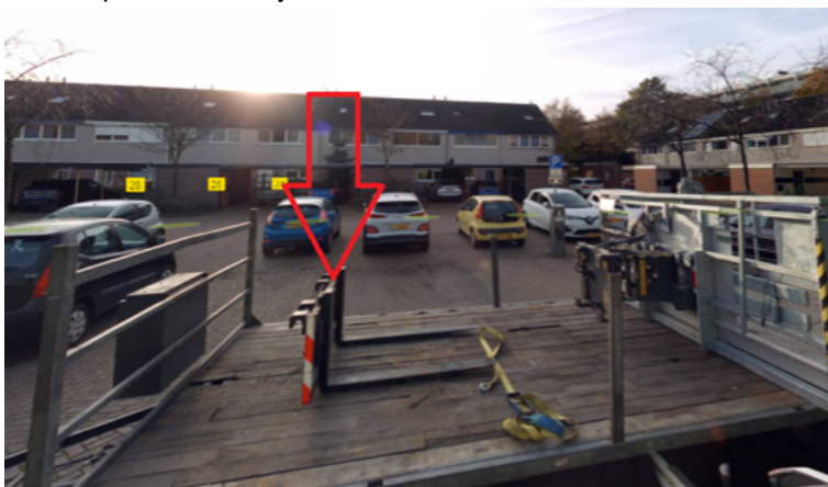
13. Irenehof 1 te Cuijk: