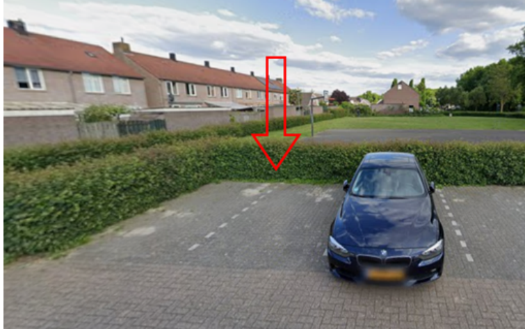
8. Michiel de Ruyterstraat 5 te Boxmeer: