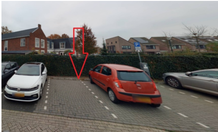
24. Stadhouderslaan 17 te Grave: