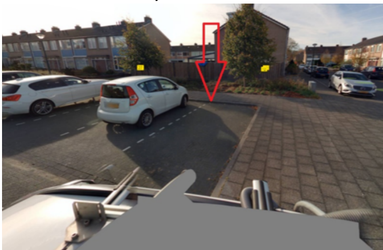
15. Maasveld 40 te Cuijk: