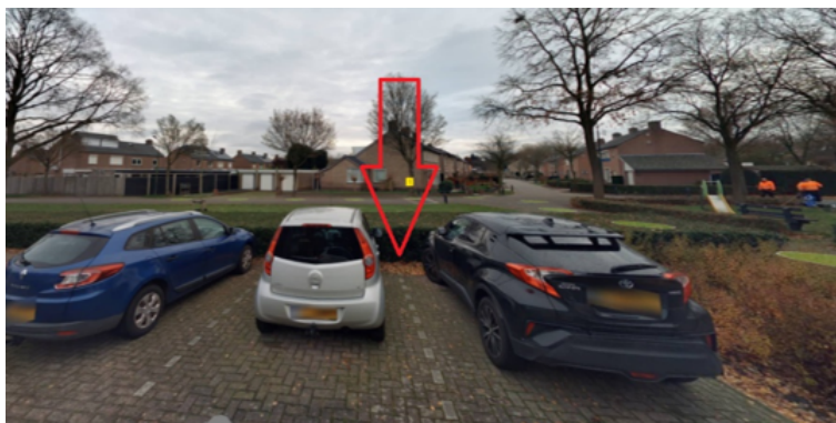
37. Randweg 37 te Sint Anthonis