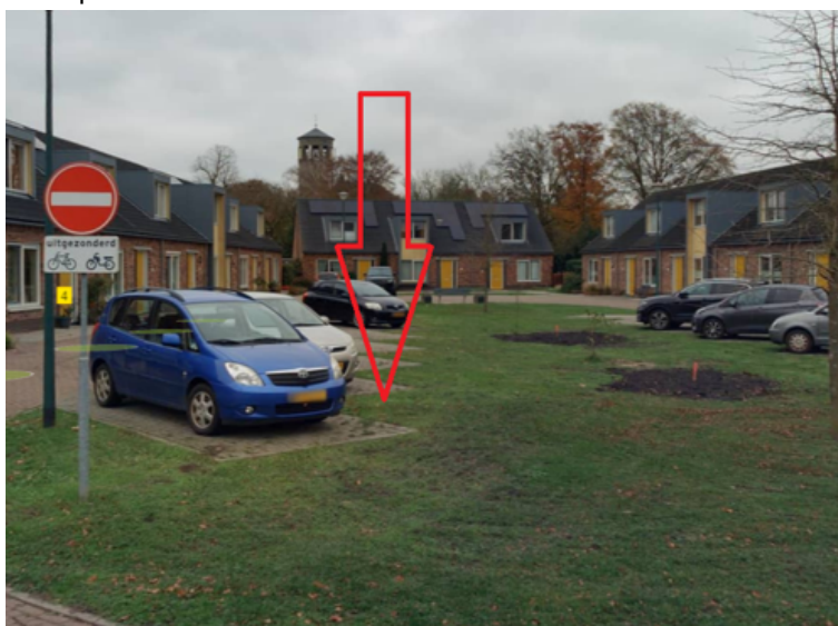
33. Mulderserf 5 te Oploo: