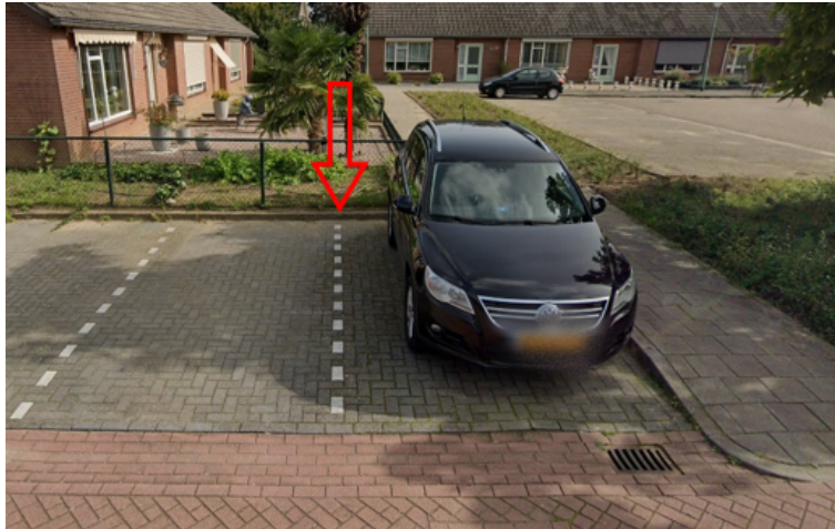
41. Soetendaal 5 te Vierlingsbeek: