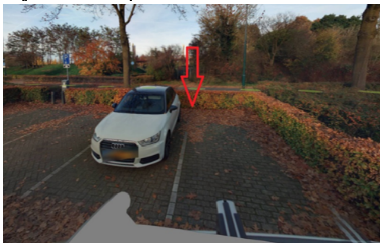
19. Zomereik 19 te Cuijk: