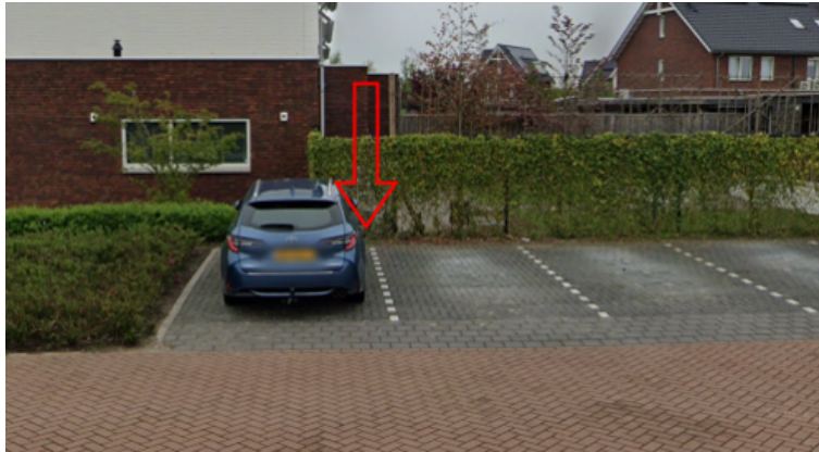
20. Zuring 90 te Cuijk: