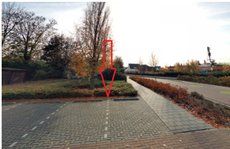
14. Keurvorsterstede 12 te Cuijk: