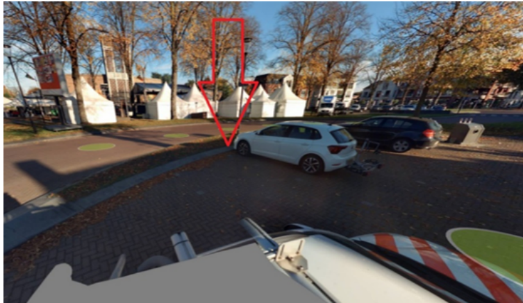
35. Derpshei 44 te Overloon: