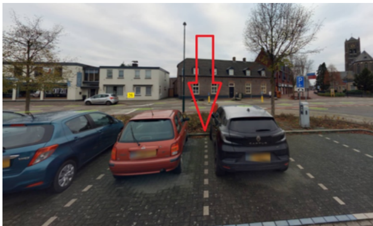
32. Tiendplein 1 te Oeffelt: