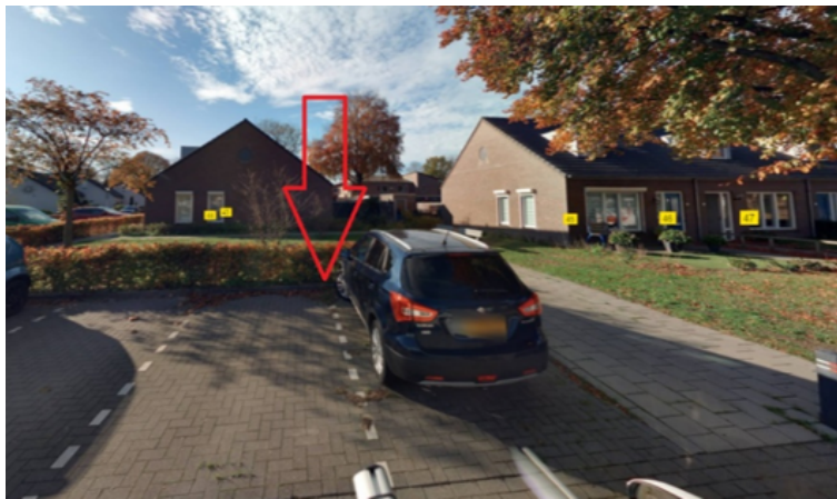
36. Eremietenstraat 8 te Sint Anthonis: