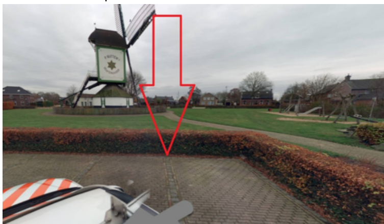
34. 14 Oktoberplein te Overloon: