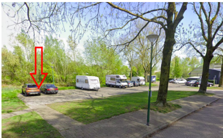
25. Traverse 164 te Grave: