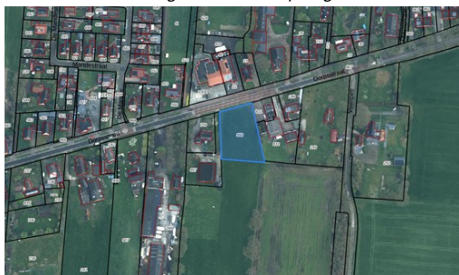
Afbeelding 1.2 Luchtfoto plangebied

In afbeelding 1.2 is de ligging en begrenzing van het plangebied weergegeven. Het gaat om perceel 'Donkerbroek H 958' met een oppervlakte van circa 2.049 m 2 . Het plangebied ligt tussen Dorpstraat 58 en 64/64a te Haule. Aan de westkant ligt een woonperceel (nr. 58). Oostelijk van het plangebied is Café Tante Nel (nr. 64) met de bijbehorende bedrijfswoning (nr. 64a) gelegen. Tegenover het plangebied, aan de overzijde van de Dorpsstraat, ligt basisschool De Trede (nr. 55) en dorps huis De Mandé (nr. 57). Aan de zuidkant grenst het plangebied aan agrarische percelen.