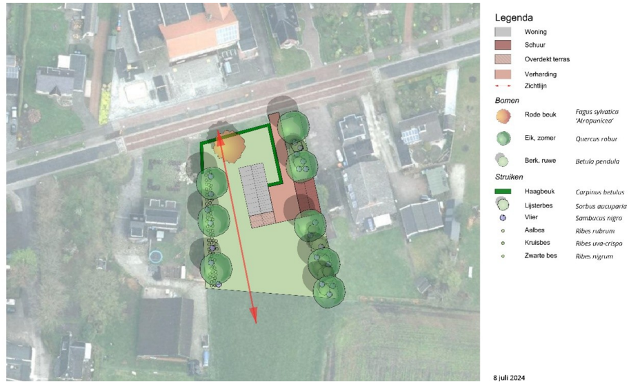
Afbeelding 2.3 Stedenbouwkundig ontwerp