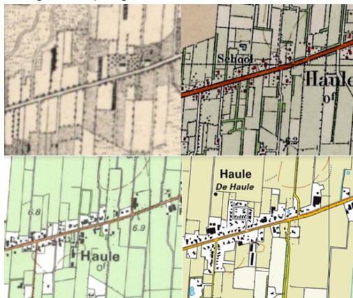
Afbeelding 2.2 Het plangebied omstreeks 1900, 1930, 1990 en 2023