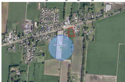
Afbeelding 4.3 Omgevingsveiligheid

Bij het groepsrisico is sprake van 'aandachtsgebieden'. Risicovolle activiteiten hebben van rechtswege aandachtsgebieden (artikel 5.12 Bkl). Dit zijn gebieden rond activiteiten met gevaarlijke stoffen die zichtbaar maken waar mensen binnenshuis, zonder aanvullende maatregelen onvoldoende beschermd zijn tegen de gevolgen van ongevallen met gevaarlijke stoffen. Het gaat om ongevallen vanwege brand, explosie en een gifwolk. Afhankelijk van het type activiteit met gevaarlijke stoffen, gelden voor het aandachtsgebied vaste afstanden of te berekenen afstanden (bijlage VII Bkl). Binnen een aandachtsgebied kan sprake zijn van een voorschriftengebied. Een gemeente kan in het omgevingsplan afzien van aanwijzing van een brand- of explosievoorschriftengebied of een kleiner brand- of explosievoorschriftengebied aanwijzen (artikel 5.14 Bkl). Als het initiatief ligt in een voorschriftengebied, dan gelden voor nieuwbouw aanvullende bouweisen uit het Besluit bouwwerken leefomgeving (Bbl, artikel 4.90 t/m 4.96). Voor zeer kwetsbare gebouwen, zoals scholen, kinderdagopvang en verzorgingshuizen, geldt altijd een voorschriftengebied. Hierop zijn dus aanvullende bouweisen van toepassing (artikel 5.14 Bkl). Los van een eventueel voorschriftengebied kan de gemeente aanvullende eisen stellen, bijvoorbeeld aan vluchtroutes en de bereikbaarheid van het gebied door hulpdiensten. Dergelijke eisen worden opgenomen in het omgevingsplan dan wel in de omgevingsvergunning.