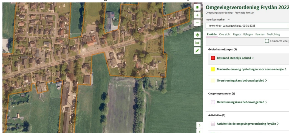
Afbeelding 3.1 Contour Bestaand Stedelijk Gebied