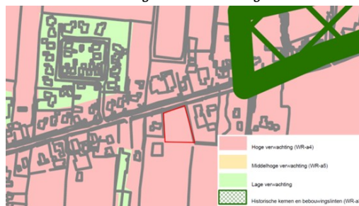
Afbeelding 4.5 Uitsnede Archeologische verwachtingskaart en beleidsadvieskaart

Op grond van de Omgevingsverordening provincie Fryslân moet er getoetst worden aan de Friese Archeologische Monumentenkaart Extra (FAMKE). Het gemeentelijk beleid voor archeologie is opgenomen in de Nota Archeologie (december 2014), de Archeologische Monumentenkaart en de Archeologische verwachtingskaart en beleidsadvieskaart. Voor cultuurhistorie en landschap zijn met name de Omgevingsvisie Ooststellingwerf, de Welstandsnota en het procesboek 'Ontwikkeling (agrarische) erven Ooststellingwerf' van belang. De archeologische (verwachtings)waarden en de cultuurhistorische waarden zijn vertaald naar archeologische resp. cultuurhistorische dubbelbestemmingen in het Omgevingsplan gemeente Ooststellingwerf.