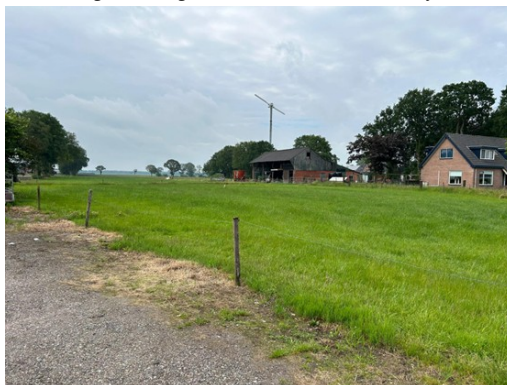
Afbeelding 1.1 Plangebied vanuit noordoosten (juni 2024)

JAMW Agrarisch OG B.V. (hierna: 'initiatiefnemer') is voornemens om op het agrarisch perceel tussen Dorpstraat 58 en 64/64a te Haule, woningbouw te realiseren. Het gaat om een inbreiding binnen het bebouwingslint met een vrijstaande woning. Op 26 maart 2024 heeft het college van burgemeester en wethouders van de gemeente Ooststellingwerf besloten hieraan in principe medewerking te verlenen. Daarbij is overwogen dat het toevoegen van de woning bijdraagt aan het terugdringen van het woningtekort en dat de locatie geschikt is voor woningbouw. De initiatiefnemer heeft het plan stedenbouwkundig uitgewerkt - aan de hand van het advies uit het principebesluit - en een participatietraject doorlopen. Op basis daarvan wordt nu het omgevingsplan gewijzigd.