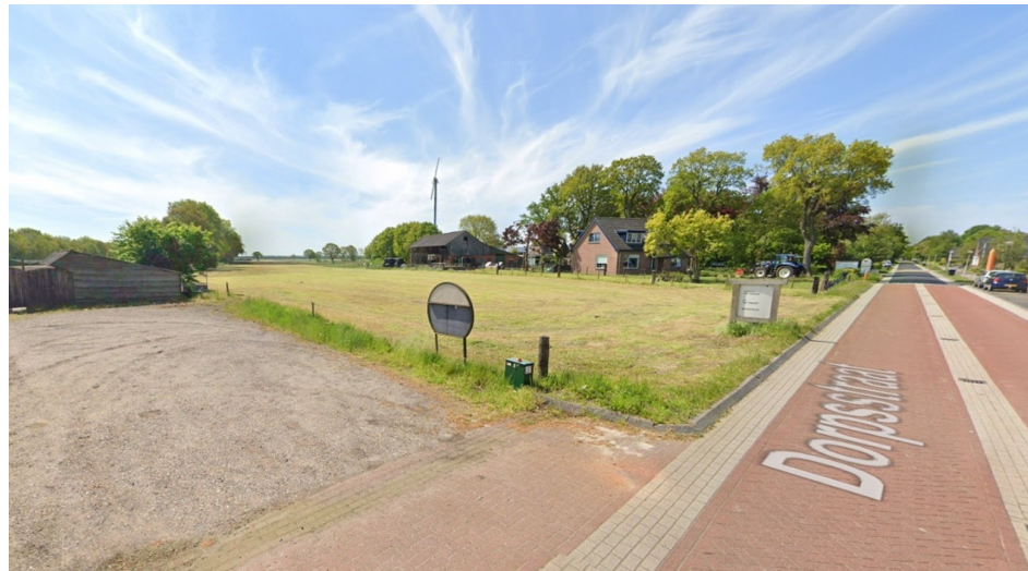
Afbeelding 2.1 Plangebied vanuit noordoosten

In afbeelding 2.1 is een foto van het plangebied opgenomen. De locatie ligt in het bebouwingslint van de Dorpsstraat in Haule. Het gaat om een open ruimte tussen een woonperceel (nr. 58) en Café Tante Nel (nr. 64) met de bijbehorende bedrijfswoning (nr. 64a). Het plangebied heeft een oppervlakte van circa 2.049 m 2 en is in gebruik als grasland. Er is geen opgaande beplanting aanwezig. Sloten ontbreken eveneens. Aan de zuidzijde grenst het plangebied aan agrarische percelen. Tegenover het plangebied, aan de overzijde van de Dorpsstraat, liggen basisschool De Trede (nr. 55) en dorpshuis De Mande (nr. 57).