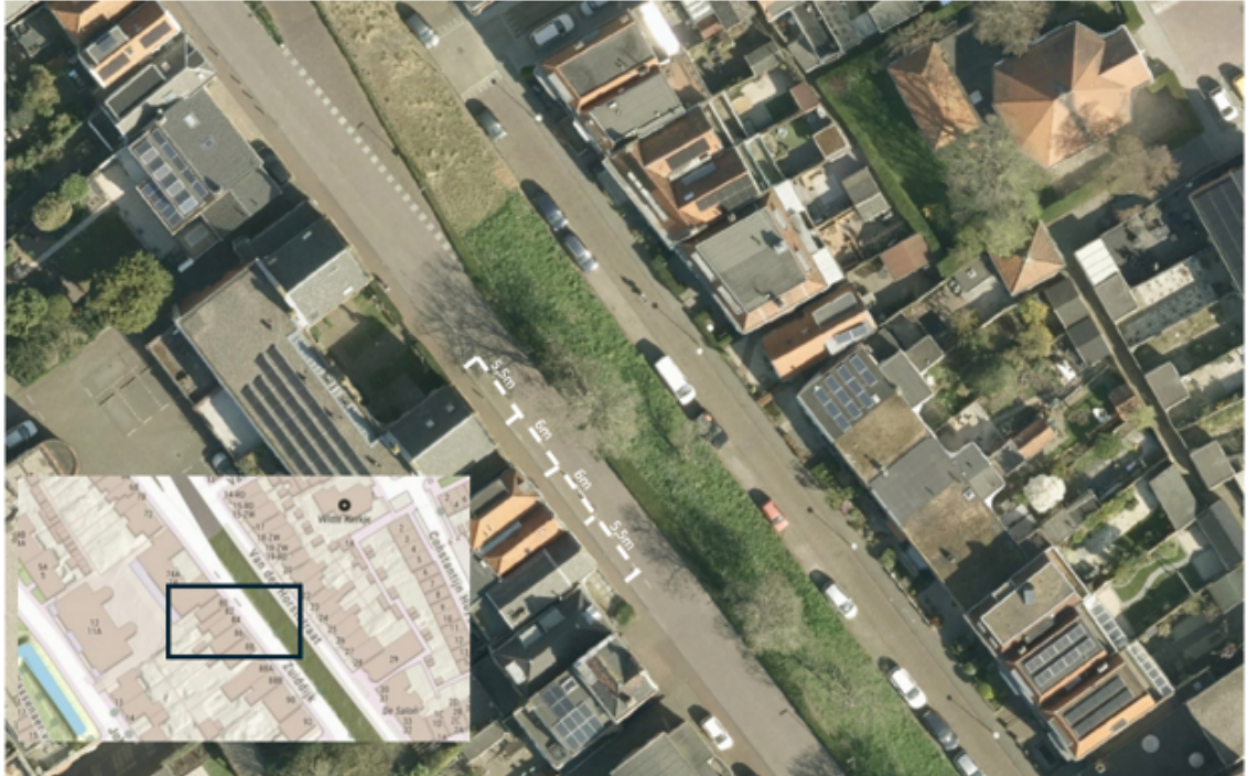
Het aanbrengen van parkeervakken ter hoogte van parkeerterrein Fenacoliusplein