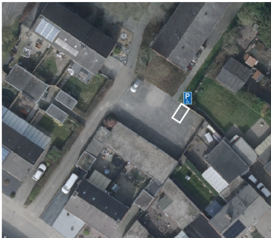
Afbeelding 2: GPP In 't Kleinven 10