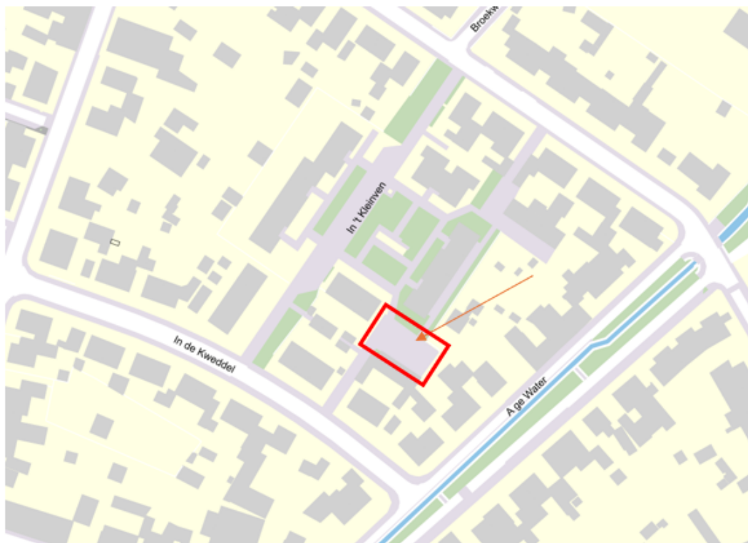
Afbeelding 1: Invalidenparkeerplaats In 't Kleinven t.h.v. 10