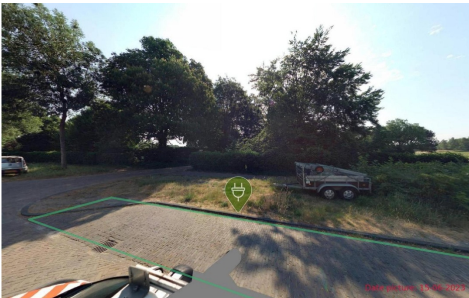
7. Gooiergracht 69