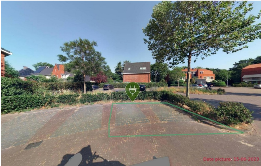
6. erfgooiersweg 29