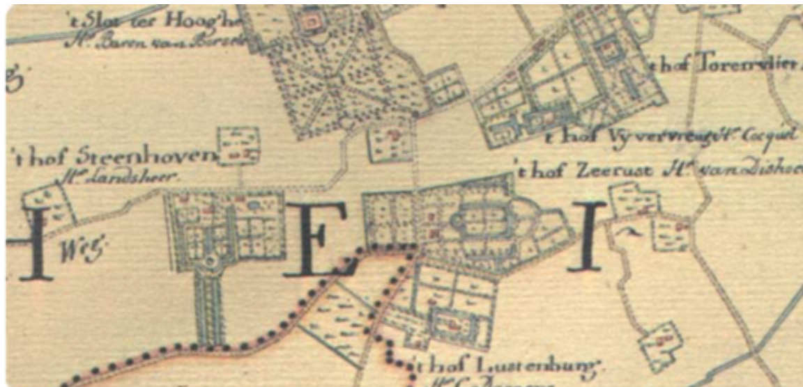
Via de website Topotijdreis is de veranderende situatie over de afgelopen eeuwen te zien