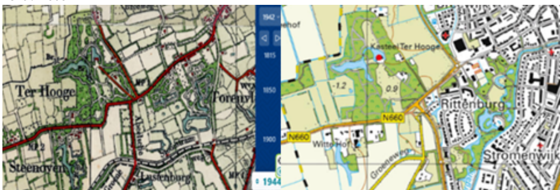
1944 / 2025