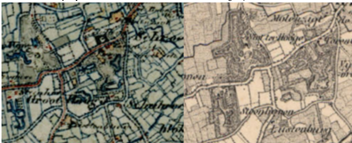
1845 / 1903