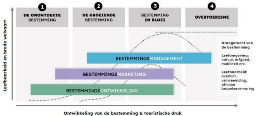
Figuur 1: Model waardevolle recreatie en toerisme (Bureau voor Ruimte en Vrije Tijd)