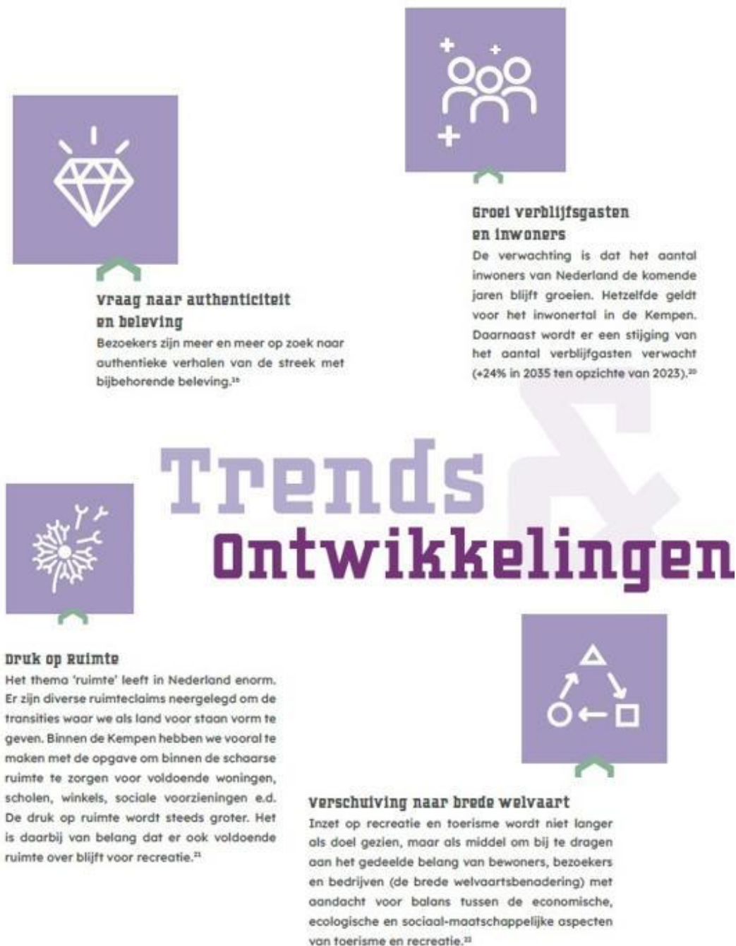
Figuur 3: Belangrijkste trends en ontwikkelingen recreatie en toerisme voor de Kempen

recreatie (bijv. bij nieuwbouw of natuurontwikkelingen). Door de omgeving authentiek, kwalitatief en aantrekkelijk te houden, draagt deze ook in de toekomst bij aan de welvaart en leefbaarheid van de regio.