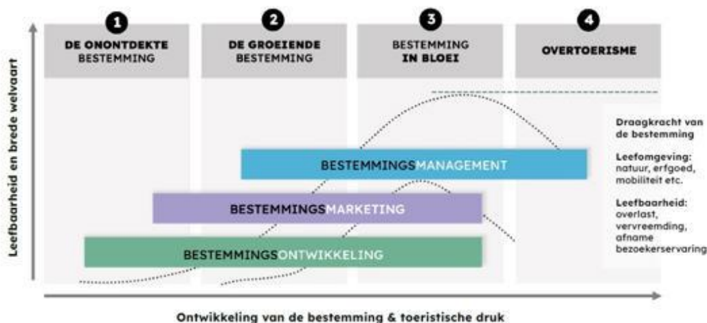
Figuur 1: Model waardevolle recreatie en toerisme (Bureau voor Ruimte en Vrije Tijd)