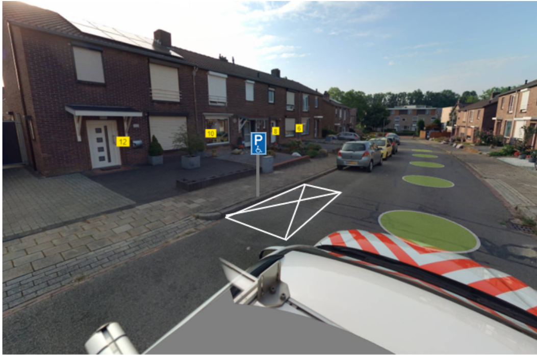
Afbeelding 3: GPP Minorstraat 15 Nuth