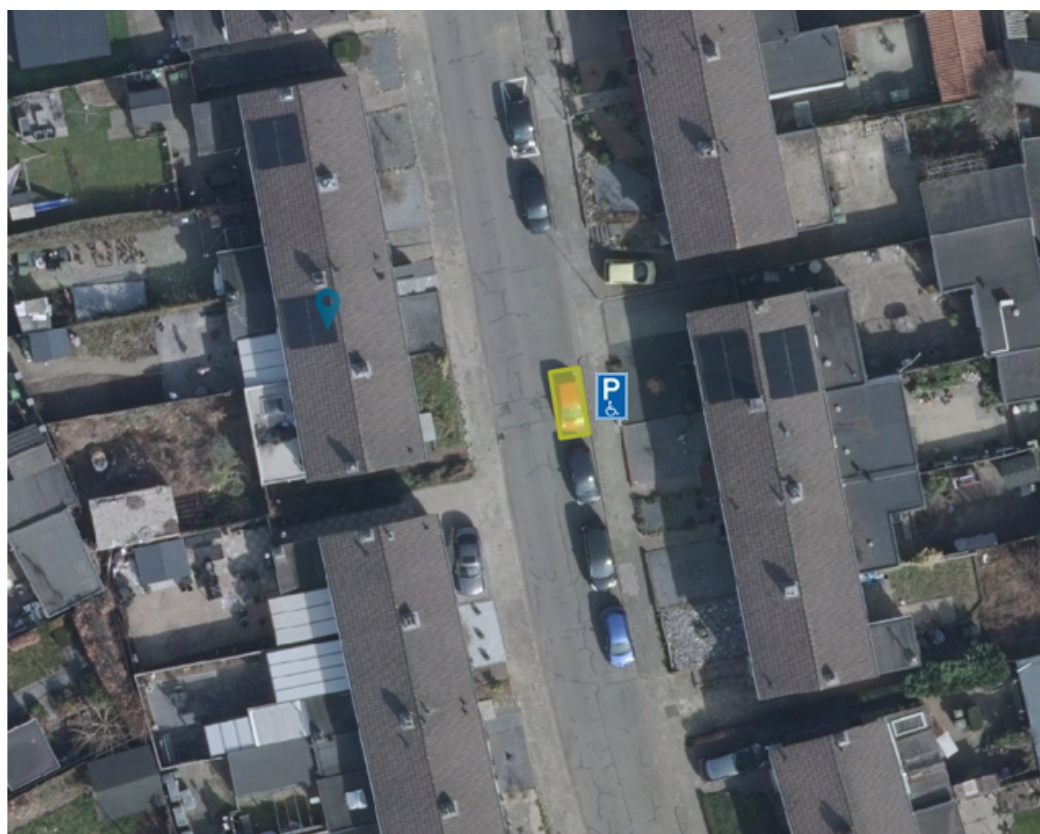
Afbeelding 2: GPP Minorstraat 15