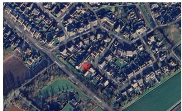
4. Locatie thv: Veenmos 71, 5427HN, Boekel