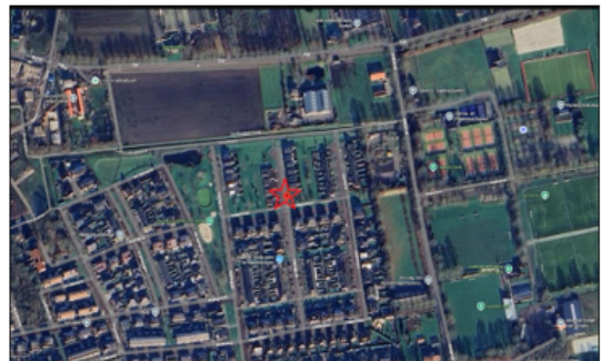
5. Locatie thv: De Vlonder 58, 5427DE Boekel