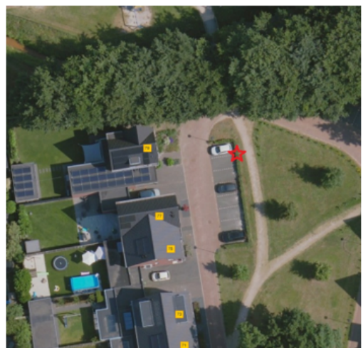
2. Locatie thv: Kievitlaan 15, 5427 VG Boekel