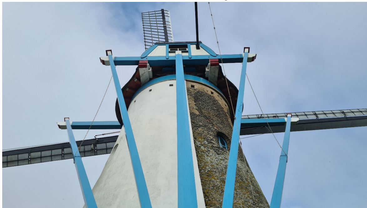
De Oude Molen in Colijnsplaat

Kortom: Noord-Beveland beschermt, ondersteunt en maakt erfgoed zichtbaar én actueel.