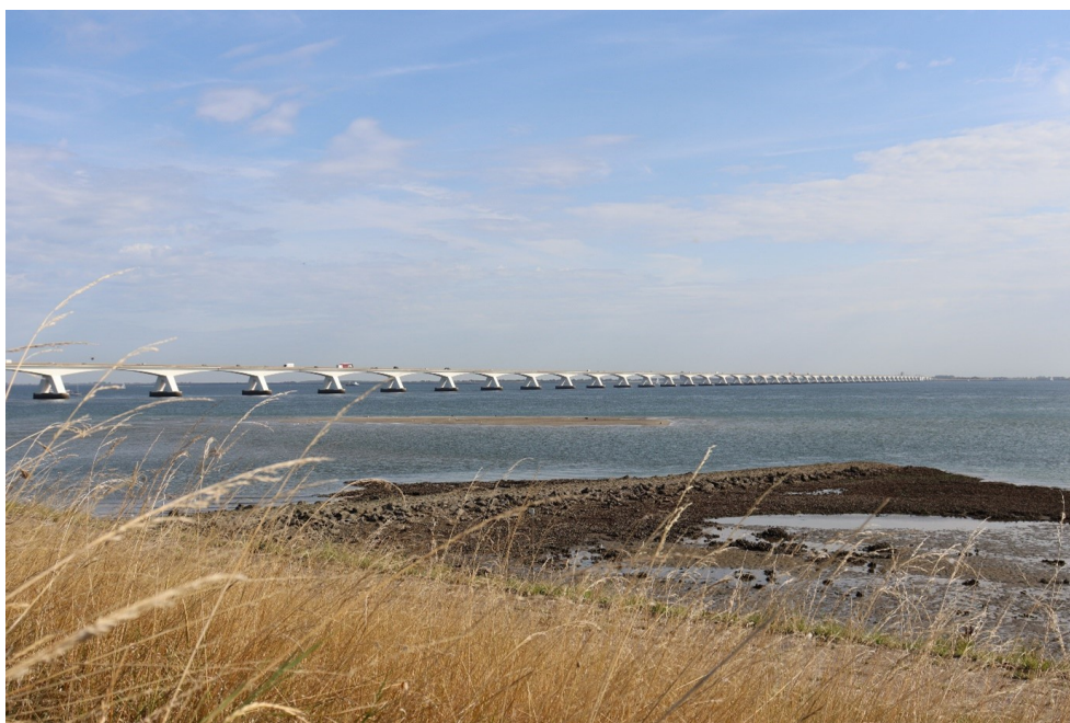
Zeelandbrug vanaf de Oostzeedijk Kats

Erfgoed spreekt een breed publiek aan en verbindt generaties, sectoren en gemeenschappen. Een verbreed Historisch Centrum kan uitgroeien tot een dynamisch platform voor behoud, beleving en benutting van erfgoed. Het wordt dan niet alleen een bewaarplaats van documenten, maar ook een inspirerende plek voor educatie, ontmoeting en samenwerking.