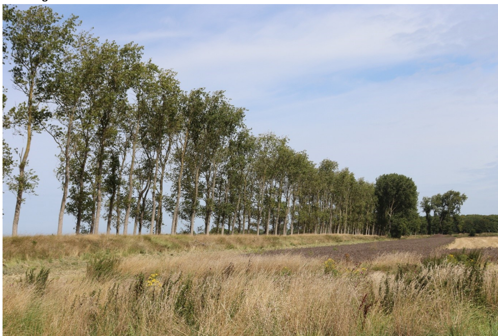
Groenedijk Geersdijk - Kortgene

Binnen deze vier thema's is de opbrengst van de participatie in verschillende acties en in het uitvoeringsprogramma uitgewerkt.