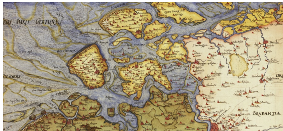
Het verdrinken Noord-Beveland op een kaart van Zeeland uit ca. 1573