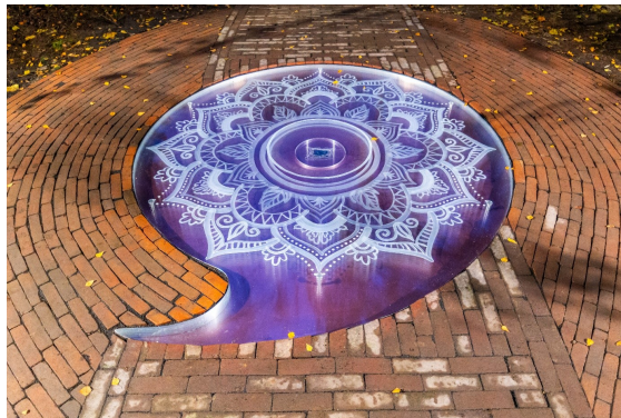
Kunstwerk 'De komma van Kortgene'