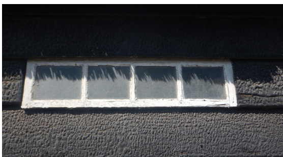
Detail van een schuur

Subsidiabele maatregelen zijn onder meer: vervanging goten, schilderwerk, dakbedekking, stoepen en stoeppalen. Voor gevelstuc, schilderwerk en kozijnen gelden historische kleuren. Het jaarlijkse budget is € 50.000. In 2025 is de uitvoering van de verordening in de jaren 2023 en 2024 geëvalueerd: 100 aanvragen, 75 toegekend, totaal € 109.000 subsidie. De meeste aanvragen betroffen schilderwerk. De meeste aanvragen gaan over bedragen tussen € 1.000 en € 2.000. Colijnsplaat had de meeste aanvragen.