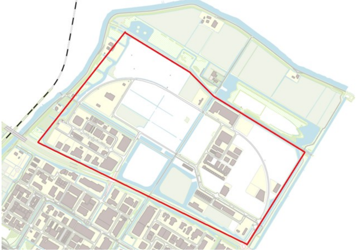
Figuur 1 Ligging bedrijventerrein Baanste Noord ten noordoosten van Purmerend

Het plangebied Baanste Noord gelegen in het noordwestelijk deel van de droogmakerij de Purmer: