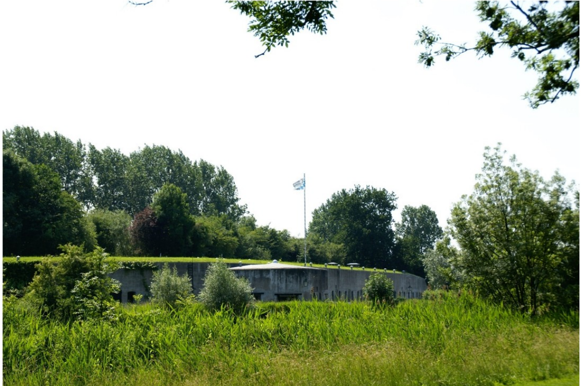
Afbeelding 3: Fort De Kwakel, onderdeel van de Stelling van Amsterdam.

De Stelling van Amsterdam is een historische militaire verdedigingsgordel die voor deel over het grondgebied van de gemeente Uithoorn loopt. Voor de verdediging van het land, gebruikte men de karakteristieken van het omringende landschap en inundatie, het onder water zetten van land zodat de vijand niet kon optrekken. De Waterlinies zorgen voor landschappelijke samenhang en een verrijking van het cultuurlandschap. De waterlinies zijn aangelegd in bestaande landschappen en liggen verscholen in het landschap. Landschappelijke aanwezige structurelementen bepaalden de linies. In het Droogmakerijlandschap en het Veenpolderlandschap loopt de liniedijk door droogmakerijen. Uithoorn en De Kwakel liggen in dit type landschap waarbij gebruik is gemaakt van de bestaande polderdijk. Vooruitgeschoven vanuit de liniedijk liggen de forten (Fort bij De Kwakel en Fort aan de Drecht) met hun schootscirkels.