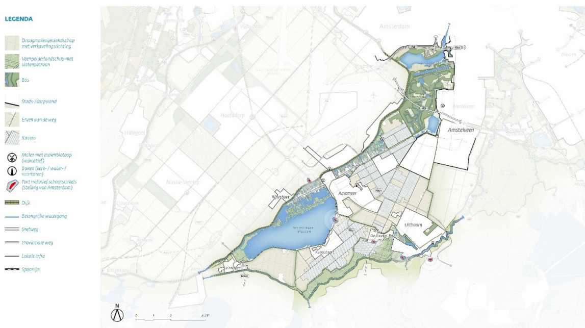
Abbeelding 2: Overzichtkaart Ensemble Aalsmeer – Uithoorn, uit de Leidraad Landschap en Cultuurhistorie.

Het ensemble bevat een complex samenstel van droogmakerijlandschap en veenpolderlandschap met plassen, ontginningslinten en restanten van het voormalige veenontginningslandschap (veenbovenlanden). Vanuit de drie provinciale kernwaarden wordt het ensemble beschreven, de landschappelijke karakteristiek, openheid en ruimtebeleving en de ruimtelijke dragers. Voor deze bouwsteen zijn met name de ambities en ontwikkelprincipes van toepassing beschreven voor het Veenbovenland Langs de Amstel aangevuld met deze voor de droogmakerijen.