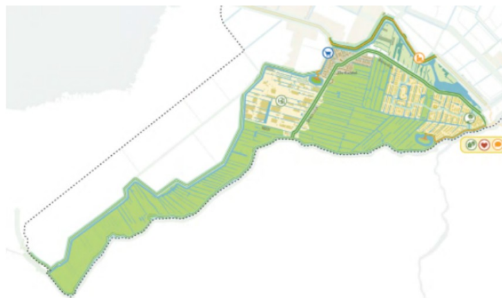
Afbeelding 5: Visiekaart Het Hoge Land, afkomstig uit de Omgevingsvisie Uithoorn 2040.

Het Hoge land omvat de gebieden binnen de gemeente die op de hoger gelegen gronden langs de Amstel en de Drecht liggen. Het Hoge Land bestaat uit veengebieden die worden gekenmerkt door een dik veenpakket en veel water, waaronder het Zijdelmeer. Denk hierbij aan het Veenweidegebied, het dorp De Kwakel, Meerwijk en het gebied de Ruilverkaveling ten zuiden van De Kwakel.