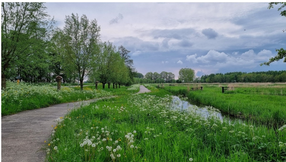
Afbeelding 4: Zicht op het Veenweidegebied grenzend aan de wijk Meerwijk en De Kwakel.

De bouwsteen richt zich specifiek op ambities rondom het behouden en toekomstbestendig maken van het open veenweidegebied in het unieke slagenlandschap en het behoud en versterken van het gebied tussen Boterdijk-Vuurlijn. Tevens ligt het in de bedoeling van het gemeentebestuur om ook het ruilverkavelingsgebied voor het deel dat is aangewezen als transformatiegebied, te betrekken bij de uitvoering van de bouwsteen. Het historische slagenlandschap bevat één van de grote open landschappelijke gebieden van Uithoorn, en heeft een aanzienlijke cultuurhistorische- en natuurwaarde. Het doel zoals geformuleerd in de omgevingsvisie, is de waarde van dit gebied behouden en waar mogelijk versterken. Ontwikkelingen dragen bij voorkeur bij aan de kwaliteiten van en ambities voor het gebied. Bij de inpassing van compensatiewoningen ter financiering van RvhL projecten is de ruimtelijke kwaliteit derhalve altijd van doorslaggevend belang. Het zowel feitelijk als planologisch opruimen van bedrijfsgebouwen, bedrijfsmaterieel en de agrarische functie, staat bij elk RvhL project voorop. Agrarische percelen worden 'terug gegeven' aan het landschap als weidegebied. De ruimtelijke transformatie van het agrarische erf naar wonen levert tevens een bijdrage aan het verder openen van zichtlijnen, over kavelsloten en waterstructuren, vanaf het lint op dat landschap.