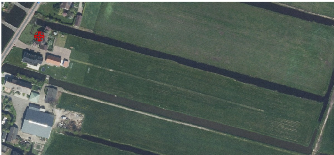
Afbeelding 3: agrarisch erf na toepassing van Ruimte voor Ruimte.