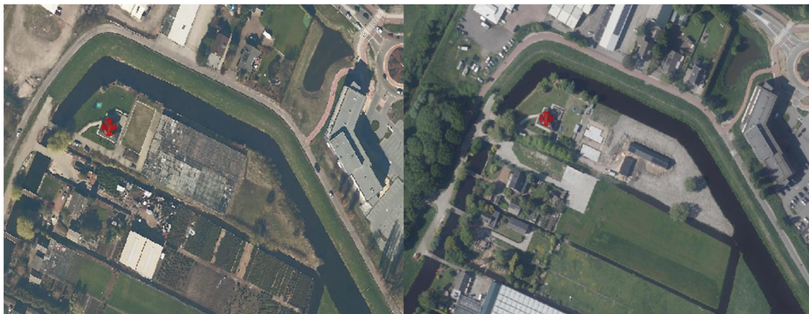
Afbeelding 1: een agrarisch erf voor en na de toepassing van de Ruimte voor Ruimteregeling.

worden intern gebruikt bij elk nieuw project om landschappelijk en qua ruimtelijke inpassing een zo optimaal mogelijk resultaat te bereiken.