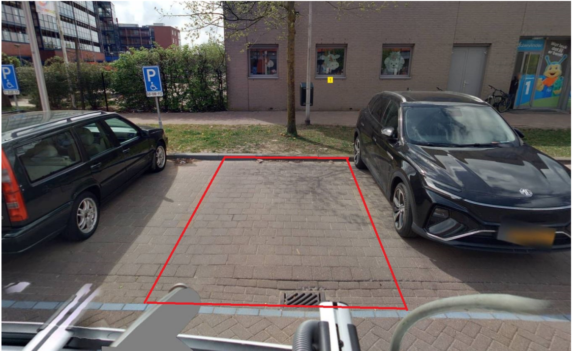
Foto van locatie aangewezen voor een gehandicaptenparkeerplaats